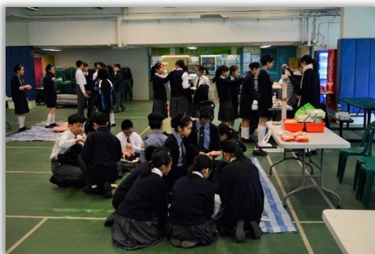
Red Cross Progressive Program Expo

10 different programmes were organised on the Post-examination Activity Day. They were the Life Education “Invisible Wings” Film Show and Talk, Reading Circle, Video Show and Sharing Session on Environmental Education, Red Cross Progressive Program Expo, STEM Talk by MTR Corporation, “Distinction” Film Show and Talk, Rope Skipping Programme, Career Life Programme, Geography Field Study and Christian Fellowship Barbecue.