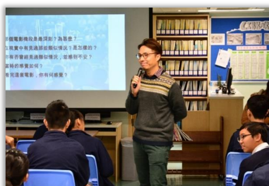
The “Distinction” Film Show and a talk on it