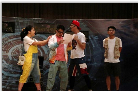
ICAC Interactive Theatre