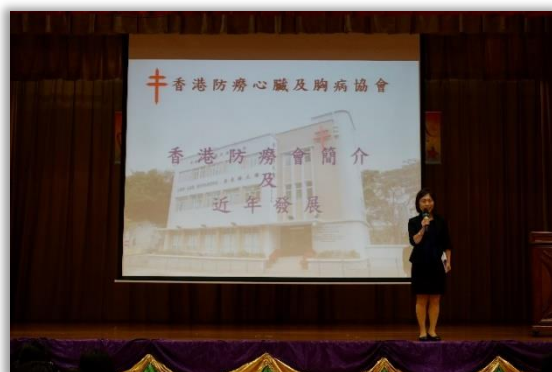
Talk on Tuberculosis Prevention