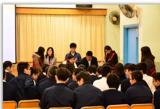
Video Show and Talk on Environmental Education