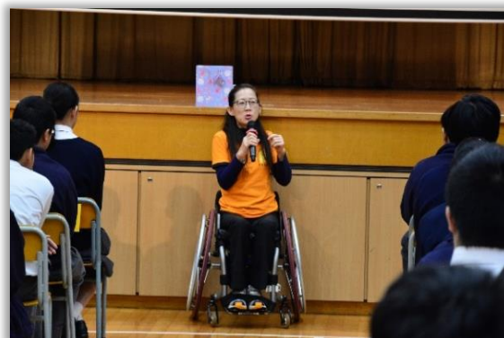
Life Education Talk — Invisible Wings