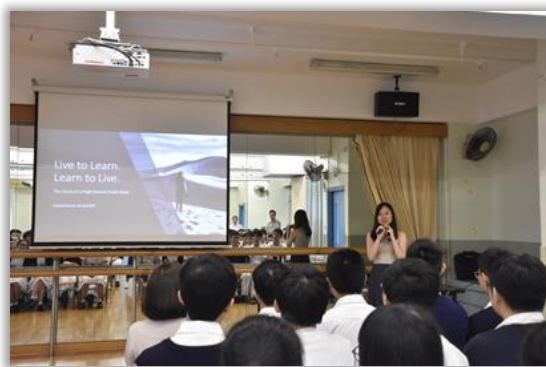
Talk by DSE Top Scorers

The Life Education Lessons were well received by our students. According to the evaluation questionnaire, 96% of our students agreed that the Life Education Lessons helped them move towards a positive and healthy life. The students of each level revealed that they had benefited from the Life Education Programmes and learnt how to deal with the difficulties they encountered in life.