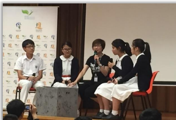
「正向思維・知行合一」 Youth Arch Foundation’s Talk

We organized a range of activities, including 「正向思維・知行合一」 Youth Arch Foundation’s Talk, iTeen Leadership Programme for Senior Secondary School Students, Life Education Talk - Invisible Wings , Civic Forum, ICAC Interactive Theatre and Integrity Postcard activity, and “InnoTech Culture” Class.