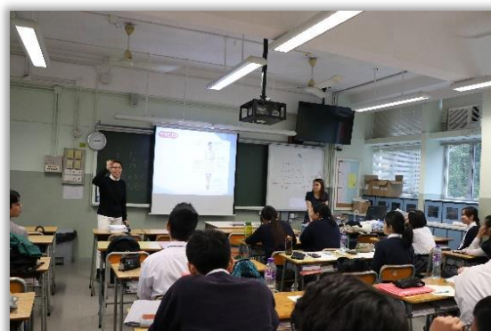
University Interview Workshop