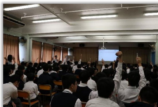
Interactive Talk on mental health