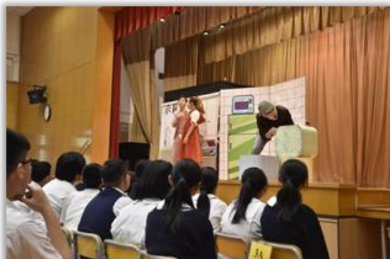
Drama about “Sustainable Development”