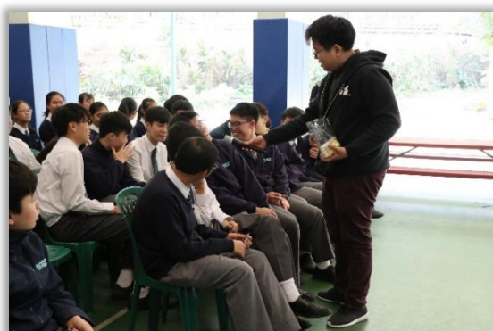
Workshop on Love Value