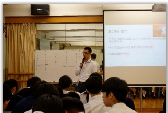
Workshop on “Stress Management”