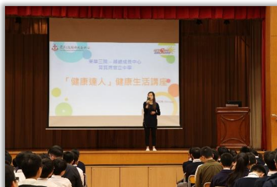
Talk on “Healthy Life and Stress Management”

Students also attended Life Education periods and the theme was 「正向思維・知行合一・豐盛人生」 this year. A variety of activities were tailor-made for different levels of study. 11 activities were organized this year. They included Volunteer service Workshop, “Healthy Life and Stress Management” Talk, Careers Talk 「七十二行你要知」 Series, University Interview Workshop, Workshop on Love Value, Interactive Talk on mental health, “Tuberculosis Prevention” Talk with Board Exhibition and Health Test, “Stress Management” Workshop, “Sustainable Development” Drama and Talk by DSE Top Scorers.