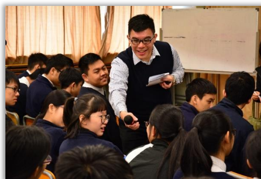
STEM Talk by MTR Corporation