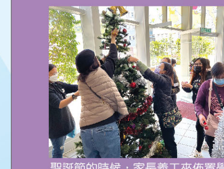
聖誕節的時候，家長義工來佈置學校。