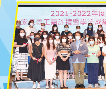
主禮嘉賓頒發義工嘉許狀予眾家長。