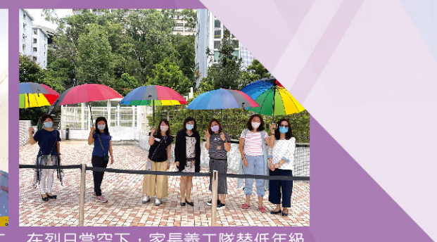
在烈日當空下，家長義工隊替低年級同學遮擋太陽。