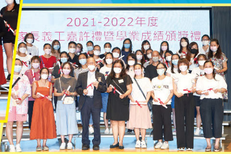
主禮嘉賓頒發義工嘉許狀予眾家長。