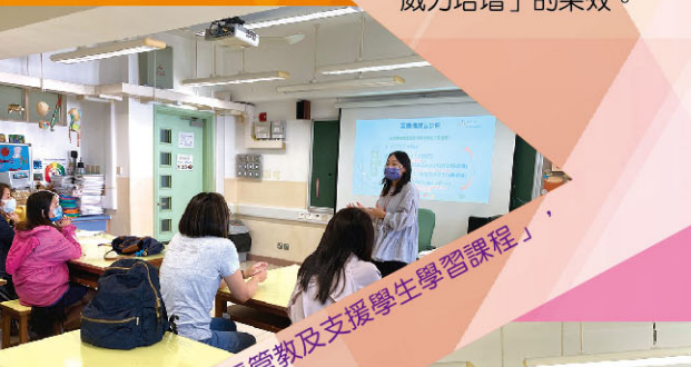
家長參與「實踐家長管教及支援學生學習課程」表現投入。