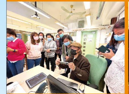
「Shot On Smartphone」家長一起運用手機拍照，樂在其中。