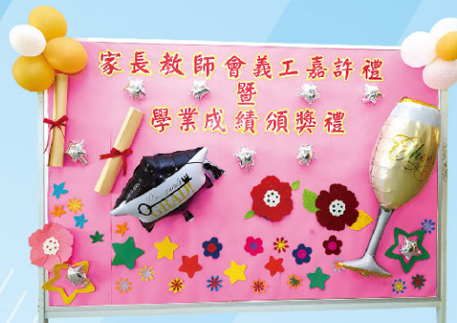
21-22年家長義工嘉許禮暨學業成績頒獎禮。