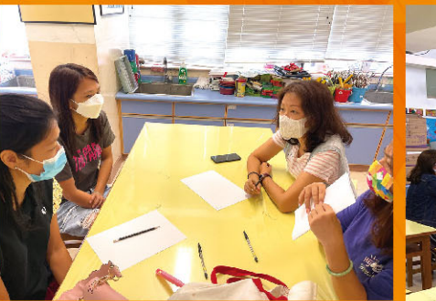
家長一起交流育兒的樂趣。