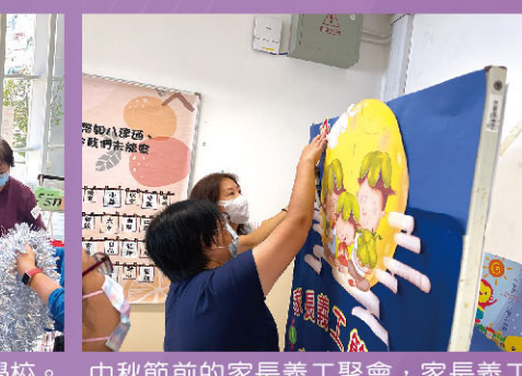
中秋節前的家長義工聚會，家長義工製作了一個既應節，又漂亮的壁報。