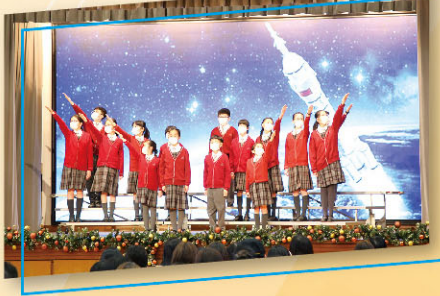
本校學生於第十一屆家長教師會周年會員大會暨學業成績頒獎禮中表演朗誦《神州歸來星河闊 逐夢未來航天情》。