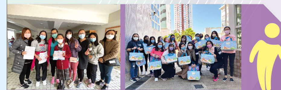
家長義工來派發小禮物給同學。

家長義工參與校內義務工作，對學校會有更全面認識，對子女的校園生活也會加深了解，親子關係得以改善，進一步瞭解子女的性格和需要，從而促進子女的健康成長。