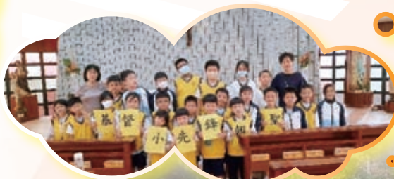
基督小先鋒到露德聖母堂朝聖