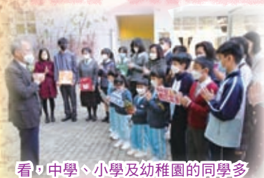
看！中學、小學及幼稚園的同學多認真！