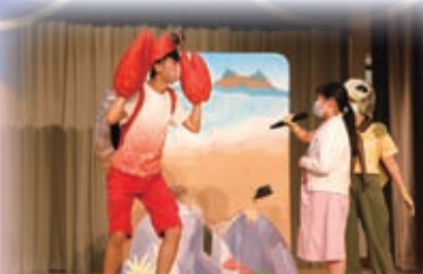
學生在欣賞話劇的過程中，認識到愛護環境和保護動物的重要。