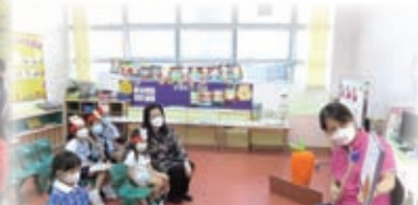
大家都很喜欢聽故事啊！