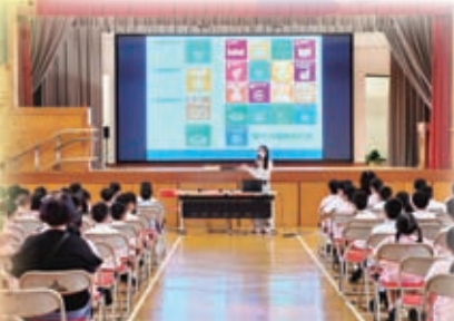
本校全體學生參與賽馬會家校【睇現】可持續發展目標計劃，活動目的是讓學生透過建立愛護環境的生活態度，實踐可持續發展目標。