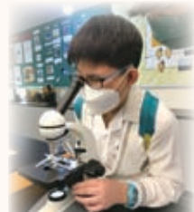
同學十分認真地使用顯微鏡，不知道他在觀察什麼呢？