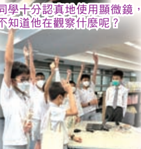
看，我們的同學表現多積極！