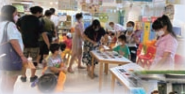
英語室的BEEBOT 遊戲，吸引不少小朋友呢！