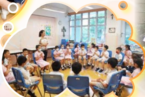
學生於宗教室進行宗教活動