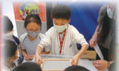
學生透過製作再生紙，認識南區地方文化及環保知識。