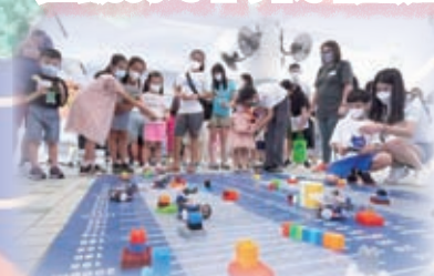
小朋友操控micro:bit 小車避開障礙物！