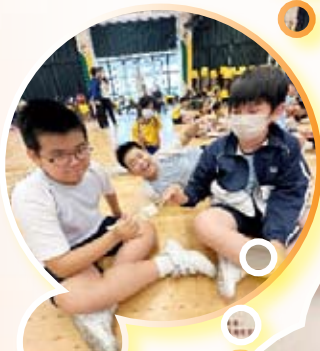
基督小先鋒參與教區聯校活動