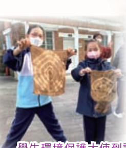
學生環境保護大使到訪龍虎山環境教育中心，參與生態導賞團、紮染工作坊與講座，加深認識龍虎山以及香港大自然相關的歷史、人文和環境生態。