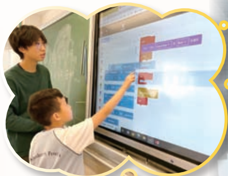
學生使用Cospace軟件製作迷宮遊戲。

本校成立STEM校隊，為學生提供資優STEM訓練，透過「動手」和「動腦」活動，培養學生對科學與科技的學習興趣。