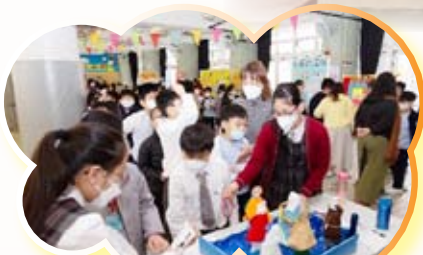
「建立伯多祿宗座慶日」攤位遊戲