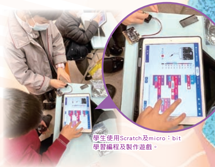
學生使用Scratch及micro:bit學習編程及製作遊戲。