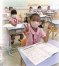
小一同學第一天在小學上課，開展愉快的小學生活！