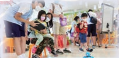
參加者操控DASH機械人進行英文遊戲，寓遊戲於學習。