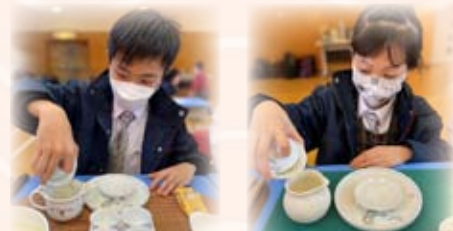
透過學習茶道禮儀，不僅讓學生體會到中華茶文化的無窮魅力，更提升了同學的文化氣質及藝術修養。