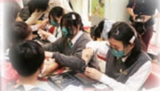
聖伯多祿中學的同學在本校環保市集中為小朋友做環保錢包。