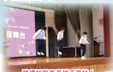
跳繩校隊真是神乎其技！