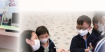
保良局莊啟程夫人(華貴)幼稚園的小朋友在英語日中玩得十分投入！