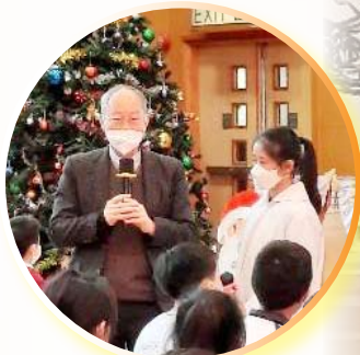
校監主持聖誕禮儀

「孩子們，我們愛，不可只用言語，也不可只用口舌，而要用行動和事實。」(若望一書 3:18)