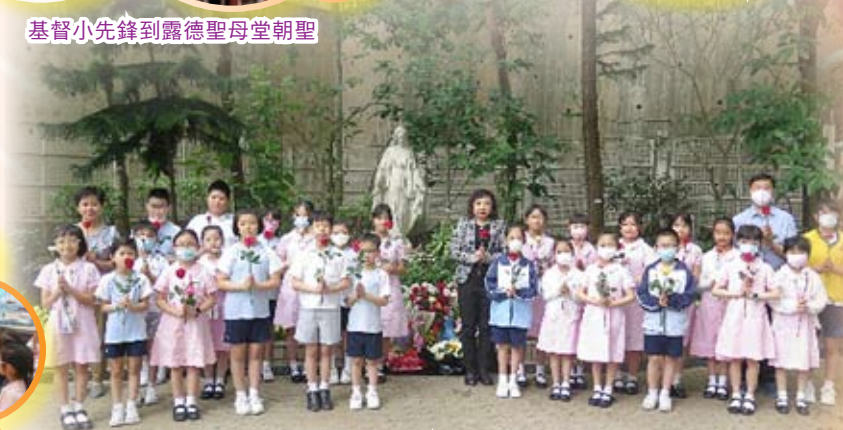
各班代表於聖母月獻花予聖母媽媽