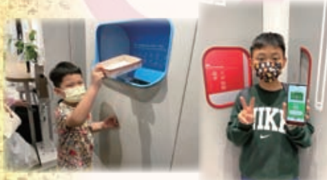
本校進行親子「綠在區區」環保活動，透過「綠在鴨洲」和「綠在田灣」，體驗回收的過程，建立「環保減廢、綠在區區」的生活態度。