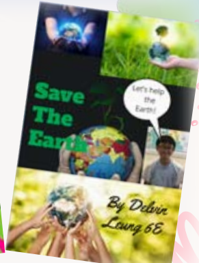
小五及小六學生運用Book Creator App製作環保宣傳小冊子，活動主題為"Go Green! Stay Green!"。