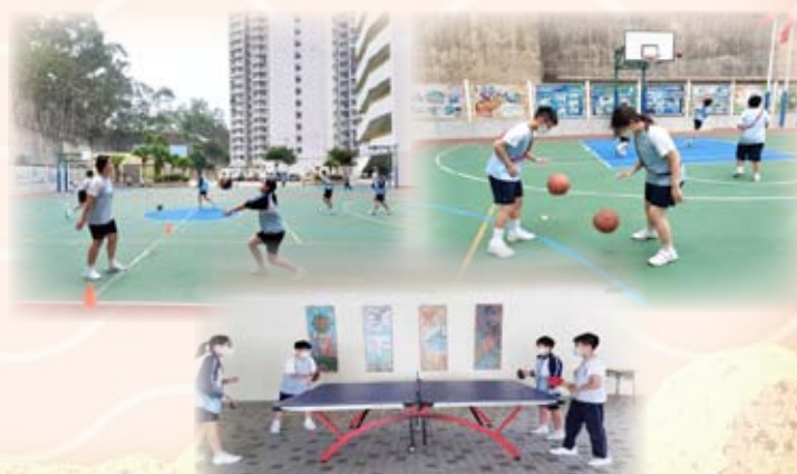
同學們十分享受健體活動的時間。

本校鼓勵同學積極參與各項體育活動，使他們能發揮潛能，各展所長，讓學生學習體育技能，獲取相關的體育知識，並養成正面的價值觀和態度，從而建立積極、活躍及健康的生活方式。