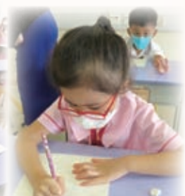
看！小朋友多認真地寫字！