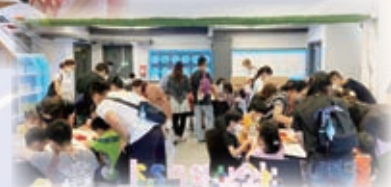
自製陀螺轉轉轉，看小朋友們多有成就感！