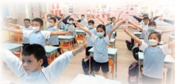
學生全程投入「醒神童喜動」早操，建立健康生活的好習慣。

為學生建立健康的生活習慣，並展現活力，本校透過參加「賽馬會家校童喜動計劃」，讓學生增加接觸體育運動的機會，每逢星期三早上，同學們都在課堂進行「醒神童喜動」早操，他們都十分專注和投入。