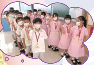
小一同學也喜歡練習排隊呢！