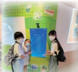
本校參加「中銀香港可持續發展大使」訓練計劃，學生在訓練過程中培養在日常生活中如何做到減碳生活的方式，以及實踐可持續生活模式。