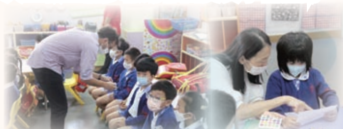
幼稚園小朋友們得到外籍英語老師的小貼紙呢！