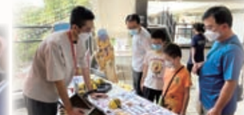
本校參與聖伯多祿中學開放日，參加人士對我們的BEEBOT十分有興趣呢！