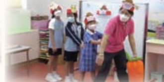
本校學生參與天主教聖伯多祿幼稚園參觀日，與幼稚園老師一起說故事。