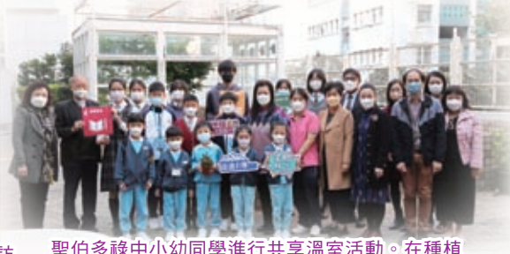
聖伯多祿中小幼同學進行共享溫室活動。在種植的過程中，學生學習種植的知識、技巧和態度，