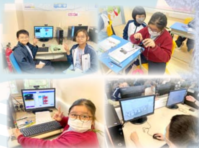
學生編寫「智能交通燈系統」的程式指令