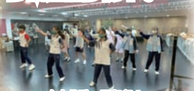
中小共融一同起舞！