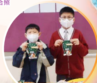
送暖行動前包裝聖誕禮物