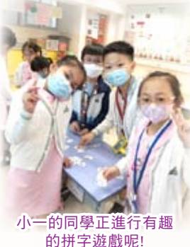
小一的小學正進行有趣的拼字遊戲呢！

為照顧學生不同的學習需要，本校與「基督教宣道會華基堂青年中心」合作，聘請資深的特殊教育老師到校開辦讀寫訓練小組，透過多感官教學法，進行有組織的課後小組讀寫訓練，以提升學生的中文學習動機及表現。