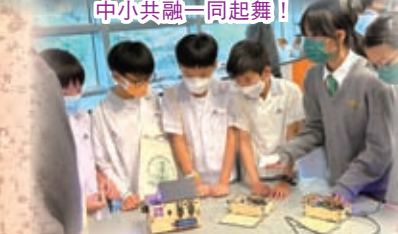
小六同學留心地聆聽中學的學姐講解！