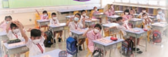
同學們踴躍回應老師的提問！