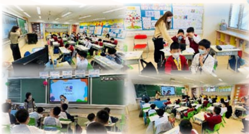
同學在英文老師示範後，用不同動作演繹課中詞彙。