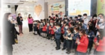
天主教聖伯多祿幼稚園的小朋友與本校學生一起種植幼苗！