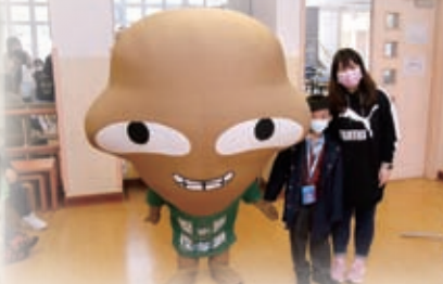
「回收你有計」親子講座邀請到鴨洲洲「綠在區區」導師向家長及學生講解地球環境問題，並示範回收步驟，讓參加者明白整個回收流程及乾淨回收的重要性，從中養成一個良好的回收習慣。