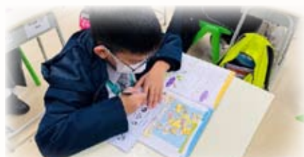
同學使用課堂工作紙，準備分享課前和課後的感受。

本年度，我校獲香港中文大學教育學院語文教育及多元素養研究中心邀請，參與「將社交情緒學習融入小學英文科課程：培養學生學習英文的正面價值觀、態度和動機」的計劃，將社交和情感學習融入小四英語課程中。