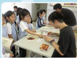
我們正學習不同植物的特點呢！