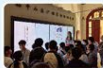
同學走出課堂學習中國歷史事件。