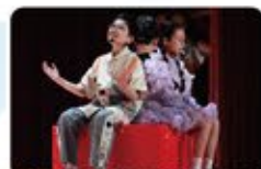
被困在虛擬世界的你會找誰求救呢？

這部優秀作品無疑是我們的驕傲，足資學弟妹效法。我們期望透過這樣的優秀演出，進一步推廣戲劇教育，培養學生的全人發展，讓更多學生有機會發掘和發揮自己的潛能，在未來的道路上綻放光彩。