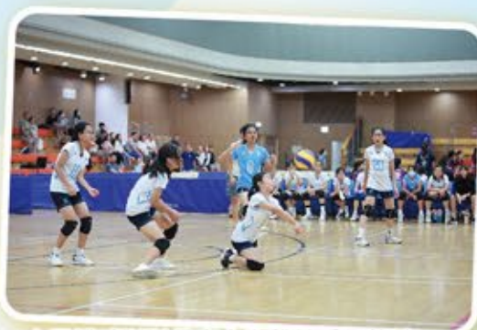
女子排球隊隊員奮力為學校爭取佳績