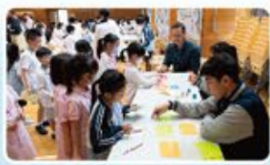
聖伯多祿中學設立攤位，外籍教師從旁協助