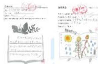
學生用心完成專題研習冊內的閱讀分享。