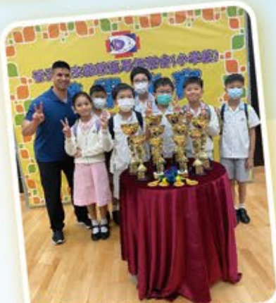
香港天主教教區學校聯會(小學組)數學比賽 齊來爭取好成績