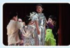
孩子們用愛觸動Robie首領，最終與機器人和解，再次獲得自由。