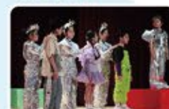
被機器人挾持的小朋友們用愛觸動Robie首領。