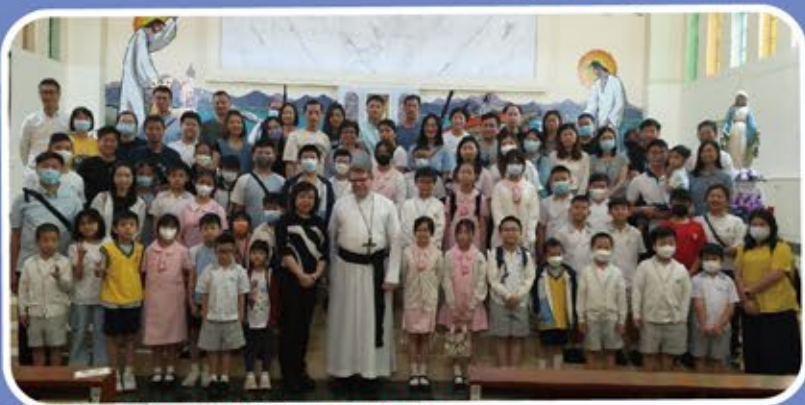
師生家長參加聖伯多祿堂主日感恩祭