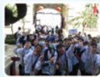
同學懷著興奮的心情參觀孫中山大元帥府紀念館。