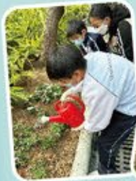
學生們於鴨洲公園裏的花床種植時花。

通過不同的社區活動，例如「南區2024年社區種植日」、「綠在鴨洲回收便利點親子義工服務」等，讓學生走出課室，善用學時，於課堂外學習如何建設綠色的社區，同時也是一種服務社區的體驗。