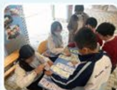
傳統節日對對碰，學習傳統中華文化。

為使學生掌握更多普通話知識，普通話科設有午間活動，讓學生在午間休息時寓學習於遊戲，從而提升學生對普通話的興趣。