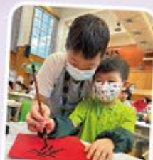
大哥哥很用心地教導幼稚園同學寫書法。