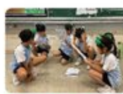
同學們都在努力排練，全力以赴準備精彩的演出。

課題：“All by Myself” 主題講述七十年代的香港。透過角色扮演，提升學生對英語的興趣，活學活用，並培養學生學會感恩現在所擁有的一切，培養正面價值觀。