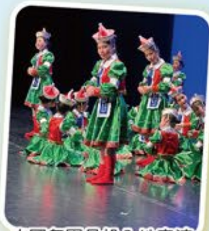
中國舞團員投入地表演