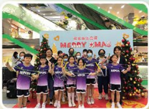
花式跳繩隊員為南區居民獻技

本校課外活動服務對象涵蓋全校學生，每年會舉辦不同的活動，例如全方位學習日、文化日活動等，透過活動提升同學多元智能發展，開拓視野。在學術方面，本校開設奧數拔尖班、英語大使、STEM校隊、中文辯論隊等，讓學生透過活動，提升學科知識和能力。在運動方面，本校有排球、籃球、田徑、乒乓球、羽毛球校隊、花式跳繩隊、競技疊杯隊等，讓同學有一展身手，啟發運動潛能的機會。藝術方面，本校設有器樂班、繪畫班、合唱團、管弦樂、中國舞等，更鼓勵同學參與校外朗誦比賽、音樂比賽、繪畫比賽等，提升同學的審美觀。