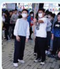
體驗中國古代運動之一的「射藝」，不知道同學有沒有「一矢中的」呢？

為了推廣中華傳統文化，本校於二月一日舉行了以「樂聚港天」為主題的中華文化日。當天安排多元化的攤位遊戲及普通話遊戲給學生進行活動，讓學生認識和體驗中國古代活動。為加強活動及中華文化氣氛，當天學生可穿華服或便服參加活動。活動那天，更邀請友校可仁幼稚園和迦南幼稚園約80名學生到校參加，分享是次活動喜樂。活動內容有趣，如花燈製作、射藝、皮影製作、畫扇等，學生非常投入，更獲贈中國風紀念品，可謂喜氣洋洋，滿載而歸。