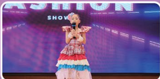
學生介紹自己的設計概念時，說明如何運用回收材料，並結合自身的想法和創意，呈現出最終的環保服飾。

學生設計和製作環保服飾，讓學生在走秀的時候表達自己的設計理念，藉着這個活動，提升學生對關注和關心地球環境問題的意識，同時也希望能夠宣傳和推廣碳中和的概念。