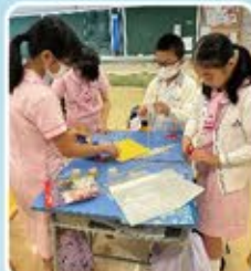
運用舊文件夾製造，更環保呢！