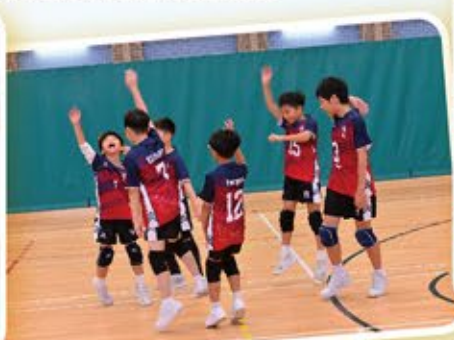
男子排球隊隊員熱烈地歡迎