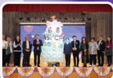
一眾來賓亮起生日蛋糕慶祝校慶