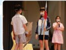
看！一眾小演員在台上揮灑自如，毫不怯場。