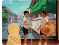
各班同學同心協力地製作精美道具，配合演出。