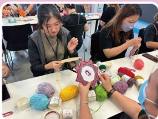
家長學習編織製作心靈結，以此來舒緩身心壓力，過程中流露出專注和滿足的神情。