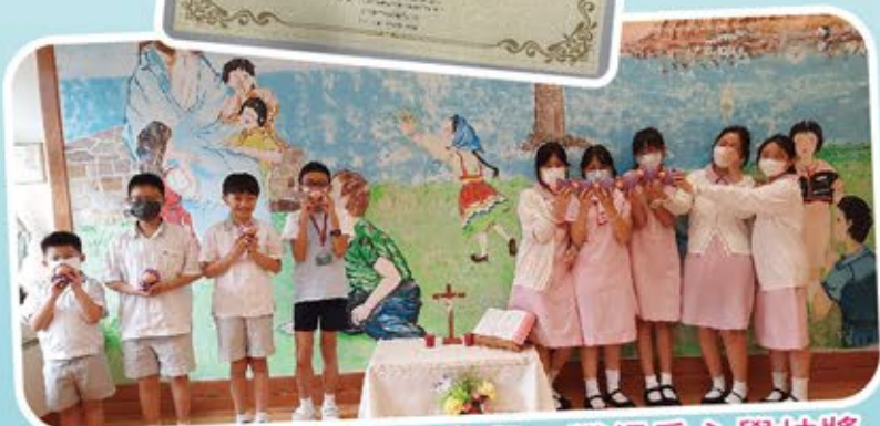
本校在四旬期內積極參與，獲得愛心學校獎