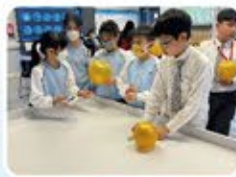
同學正在試驗自己的氣墊船能否順利滑行之。