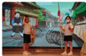
同學聲情並茂地說出對白，投入演出。

四年級同學用心演繹成語故事—《自相矛盾》，並運用創意改寫劇本，學生在演繹的過程中能更深入地了解文本，明白故事的哲理。