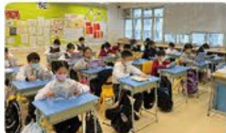
高年級同學也是我們的好榜樣，全班一起安靜閱讀，享受閱讀時光。