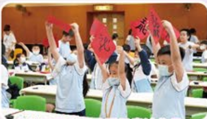
各位同學高興地展示書法作品。