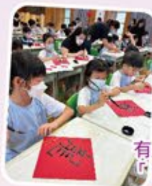
有趣的五體「龍」書法！