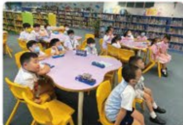
同學到圖書館留心聆聽圖書館主任介紹如何閱讀電子圖書。