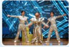
Robie機器人成功佔領人類世界。