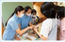
香港真光書院設立攤位