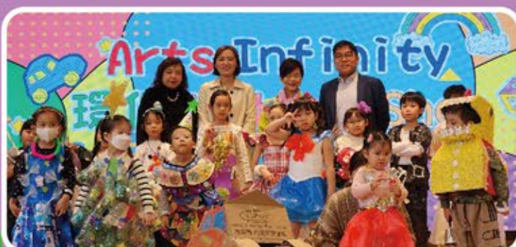
幼稚園學生設計的環保服飾，利用再生材料，創作出獨特有趣的可穿著作品，展現童心與環保理念。