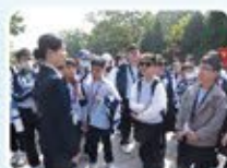
同學專心聆聽當地導賞員的講解。

為學生提供課堂外的學習經歷，加深他們對內地歷史文化、風俗特色及科技等各方面的認識。通過認識中國近代的重要歷史人物孫中山先生的生平事蹟，了解保家衛國的信念和維護國土安全的重要性，從而培養國家觀念。