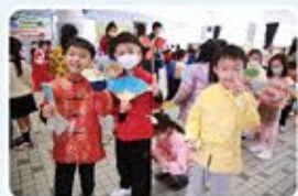
「公子有禮」，男孩子的華服打扮，是不是文質彬彬呢？