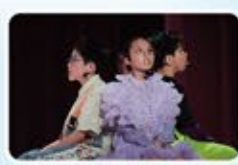
當小朋友被困在虛擬世界時，他們最懷念的就是他們的家人。