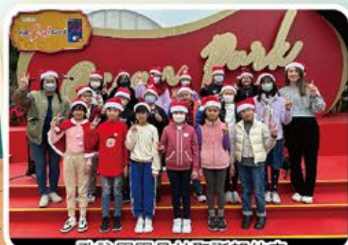
歌詠團團員於聖誕報佳音