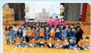
歡迎天主教聖伯多祿幼稚園學生參與攤位遊戲