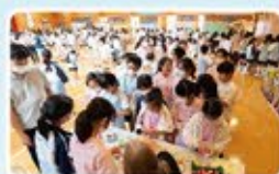
人山人海，學生都積極參與攤位遊戲