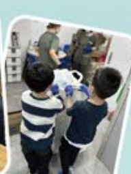
學生及其家人通過義工服務，既可以服務社會，又可以體驗環保回收的流程。