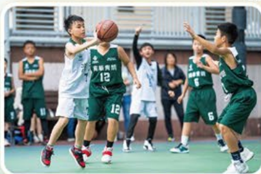
籃球隊隊員全力以赴為港天