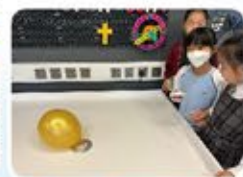
來進行一場氣墊船比賽！