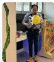
老師正教授學生以氣球自製氣墊船以探究空氣的特性。

本校於本年度參加教育局小學校本課程發展支援服務-小四常識科，此計劃主要是藉共同備課落實常識科的探究式學習，通過共同備課中的單元教學的設計，增加學生動手做的機會，並以建構知識、發展共通能力和培養正面價值觀及態度三大範疇去豐富學生的學習經歷及發展校本的探究式學習。