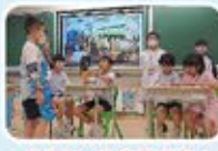
老先生，你真了不起！