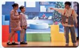
當小主角被爸媽沒收個人助理Robie之後，對父母大發脾氣。