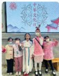
同學們穿上華服，喜氣洋洋，參加中華文化日。