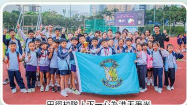
田徑校隊上下一心為港天爭光