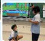
如何才能好像牛一樣又大又強壯呢？