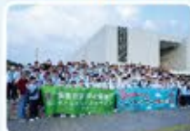
同學讚嘆辛亥革命紀念館的宏偉建築。