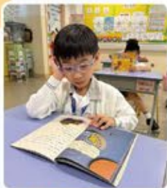
別小看這位同學，看英文書看得多投入呀！