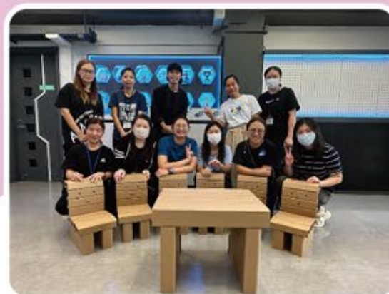
家長學習製作榫卯凳，在過程中認真實踐動手，體現了學習的樂趣和成就感，彰顯了家長互助合作的美好時光。