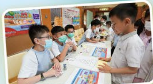
英語大使悉心地為同學講解