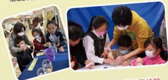
老師及學生大使於環保市集上輔助年幼的參加者進行活動。

一月舉行了「Peter換樂」環保市集，透過攤位遊戲及環保藝術作品展提高小朋友的環保意識及強化「轉廢為用」的概念。