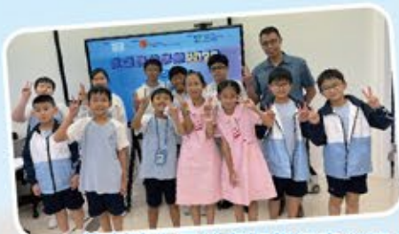
能創建自己的虛擬銀行真有趣！