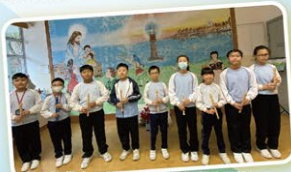
學生提供多元化藝術活動發掘學生潛能