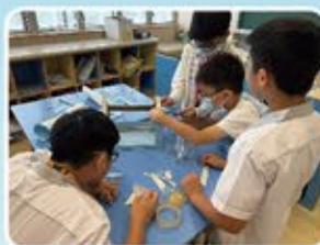
同學正在動手自製一個小型溫室。

本年度的全方位學習日共有兩日，每級同學都有機會留校透過動手製作或小實驗去學習與植物有關的知識及外出實地考察一次，希望能以多元化的教學，豐富學生的學習經歷，使他們能從愉快中學習。