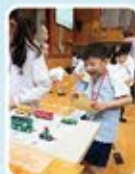
嘩！好多交通工具的模型，我已經知道英文怎麼讀