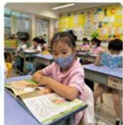
這位同學專心看書，必定獲益良多。