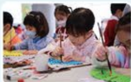
同學們親手畫扇畫。