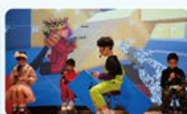
沉迷於網絡遊戲的孩子，漸漸失去自我。