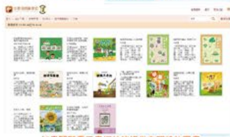
知書閣電子書網站能提供有關植物圖書讓全校學生同時下載閱讀。