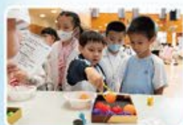
齊齊夾生果做沙拉

特別鳴謝聖伯多祿中學及香港真光書院設立攤位，學生從中學會不少英文詞彙及擴闊眼界，獲益良多。本校也感謝家長義工幫忙派發禮物，家校合作令活動流程更順暢。本校亦誠邀天主教聖伯多祿幼稚園學生參與攤位遊戲，大家都樂在其中，寓學習於遊戲，加強學生以英語溝通的主動性。