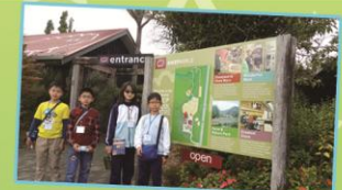
Here we are at the entrance of the Sheep World.