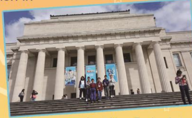
Know more about New Zealand at the Auckland Museum.