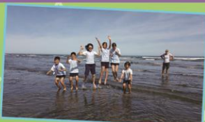
Having fun at Muriwai Beach!