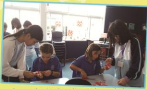
Local students enjoy doing Chinese paper cutting.