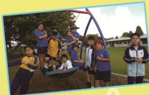
Playing on the big swing is great fun.