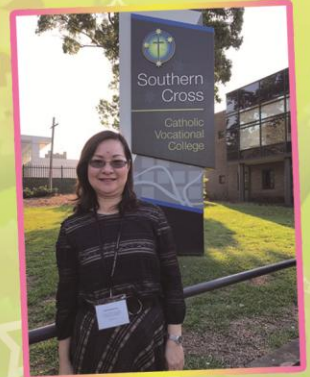
參觀澳洲悉尼天主教專上學院—Southern Cross Catholic Vocational College