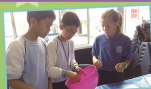
'We can cook, yeah!'