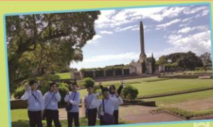
Enjoying our first lunch at Joseph Savage Memorial Park.