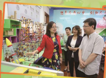
何校長對「東營一小」的STEM設置非常感興趣。