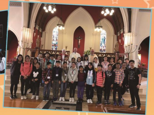
Having an Easter Mass at St Patrick's Cathedral.