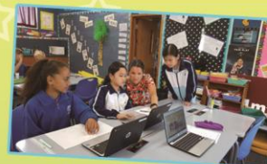
'Let's work it out, girls.'

It was the first time that I went to other country by myself and stayed with other family for such a long time. I had studied at Helensville Primary School for a week. There is a big playground and a big field. It is much bigger than our school! The students there asked me a lot about Hong Kong. My host mum is a teacher there. My host family keeps two dogs, two birds and a goldfish. They like animals very much. I walked the dog with them. It was enjoyable. In the tour, I learnt much about New Zealand and I could practise my English.