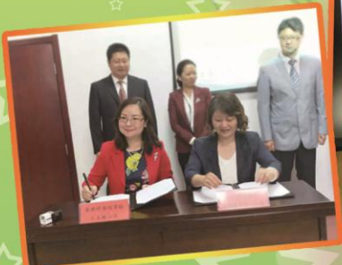
何校長與北京「東鐵匠營第一小學」簽約，締結成為姊妹學校。