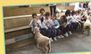
Come and milk a sheep. It's exciting.