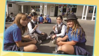
Kinki and Jasmine are enjoying the morning tea with HPS Buddies.