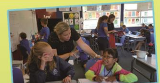
That's a good idea.' Hayley replied.