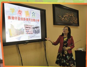
何校長向「東營一小」介紹「香港仔聖伯多祿天主教小學」。