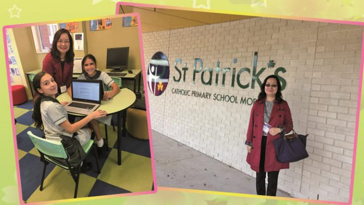
何校長到St. Patrick's Catholic Primary School 參觀，並與學生合照留念。