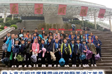
登上東方明珠廣播電視塔飽覽黃浦江美景