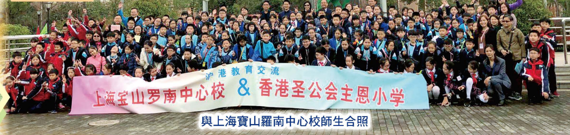
與上海寶山羅南中心校師生合照