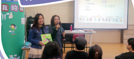
家長「正向」閱讀工作坊