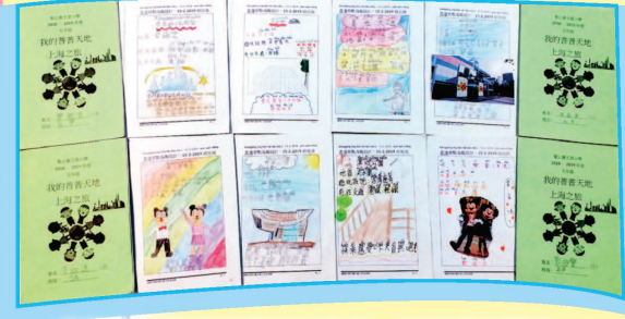
交流前，設計香港景點海報，配以漢語拼音， 有助交流溝通，推廣香港