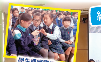
學生觀察實物，了解其類別