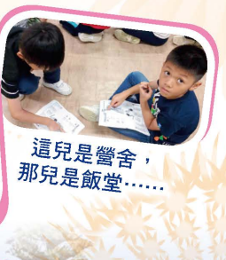
這是營舍，那兒是飯堂……