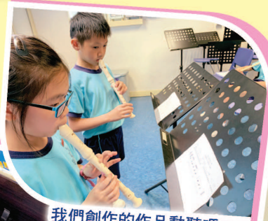
我們創作的作品動聽嗎