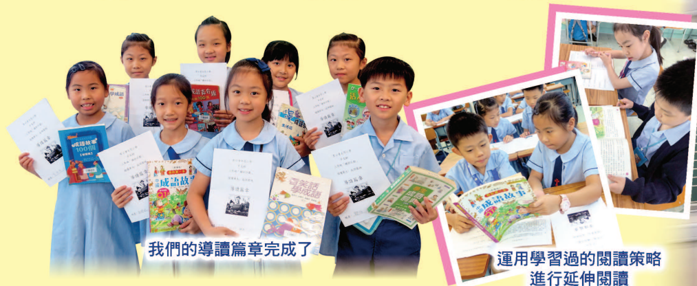
我們的導讀篇章完成了