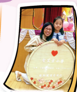
「接納關懷愛同行」引導孩子愛己愛人，榮神益人