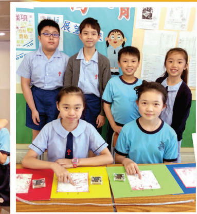
為繪畫工具設計電腦程式