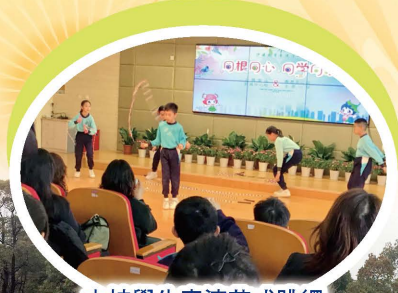
本校學生表演花式跳繩