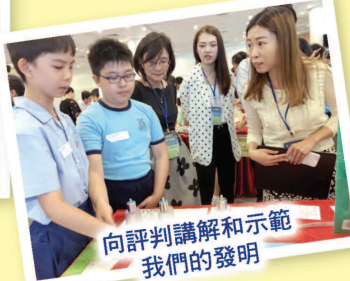
向評判講解和示範 我們的發明