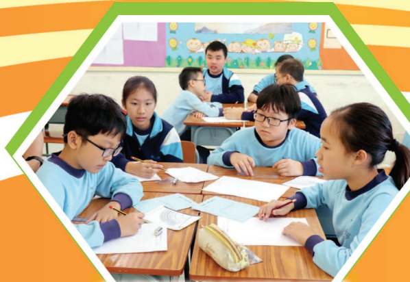
六年級學生聚精會神地製作測斜儀