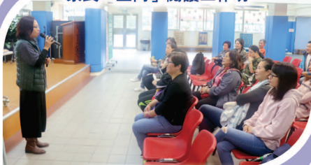
家長學習講故事技巧