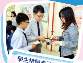
學生檢視自己的消費模式