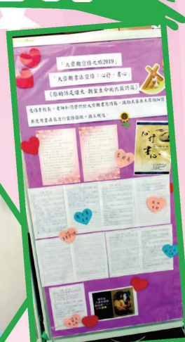
校長、老師及學生之「心抒·書心」展