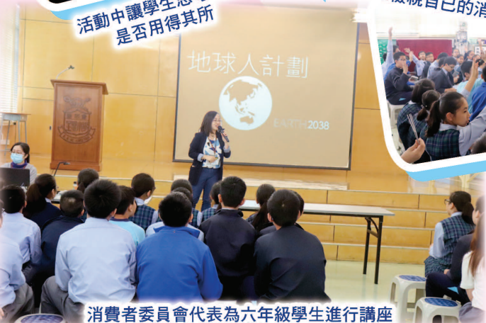
消費者委員會代表為六年級學生進行講座