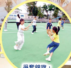
爭奪錦旗，鬥智、鬥力、鬥快