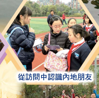
從訪問中認識內地朋友