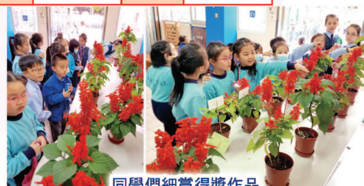
同學們細賞得獎作品