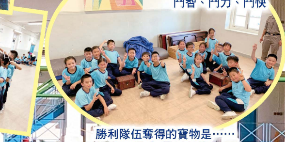
勝利隊伍奪得的寶物是……