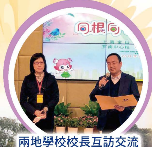
兩地學校校長互訪交流