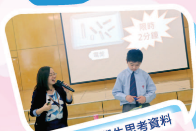
活動中讓學生思考資料是否用得其所