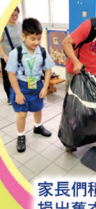
家長們積極捐出舊衣物