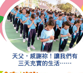
天父，感謝你！讓我們有三天充實的生活……