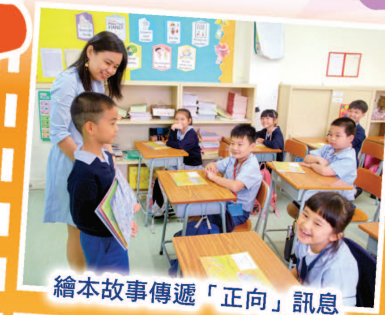
繪本故事傳遞「正向」訊息