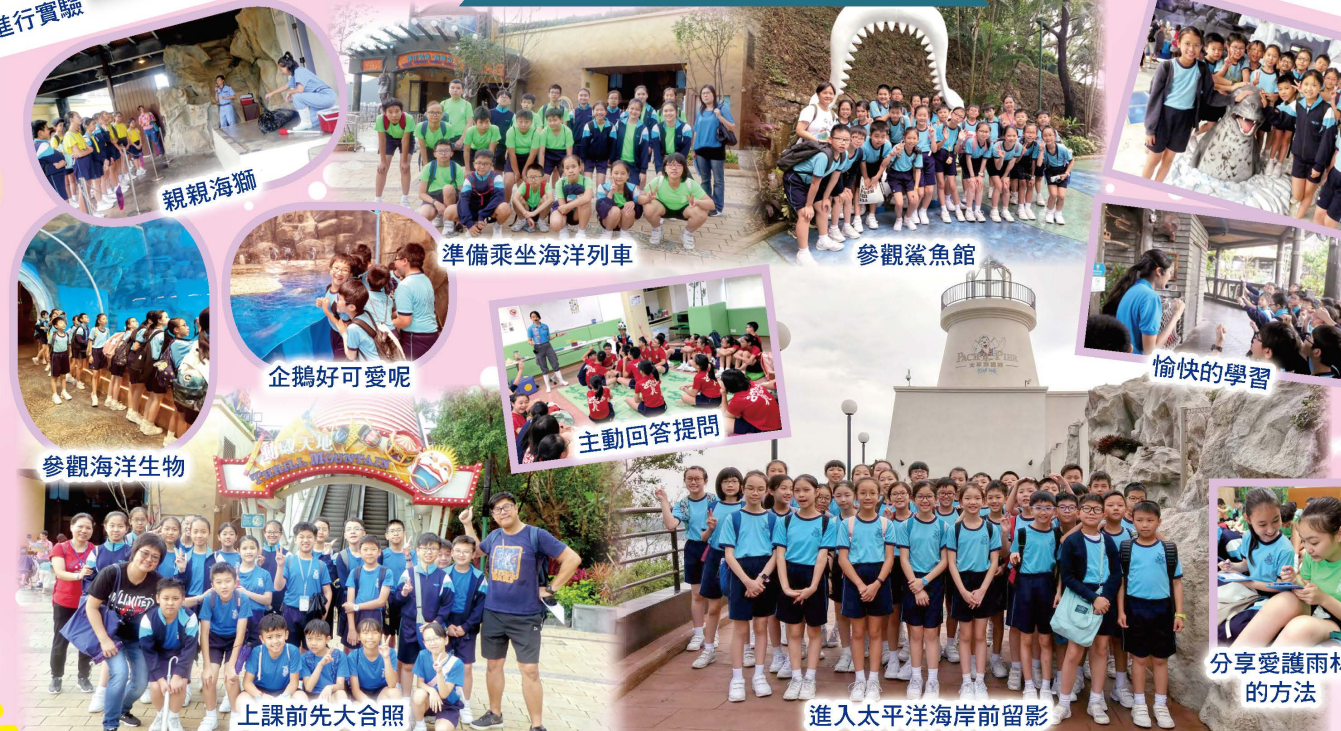
準備乘坐海洋列車