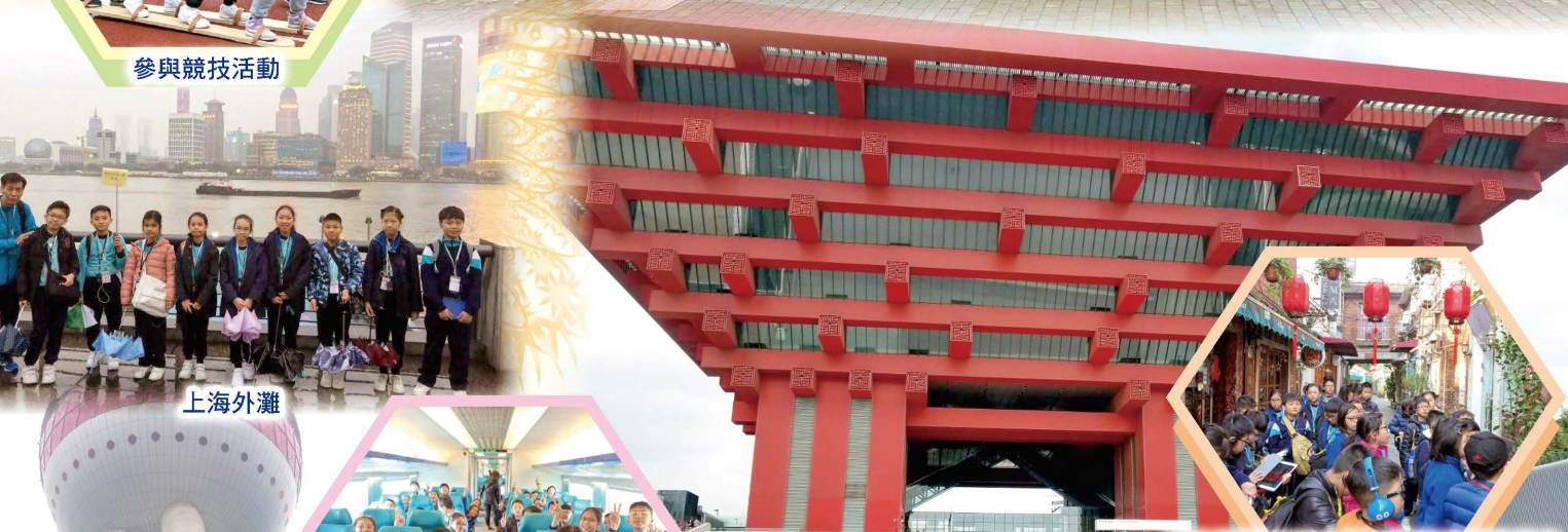
專心聆聽領隊介紹田子坊的建築特色