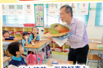
繪本精美，引發好奇心