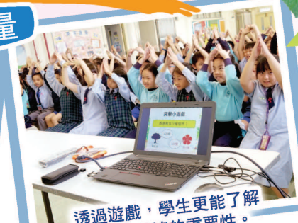
透過遊戲，學生更能了解樹木對環境的重要性。