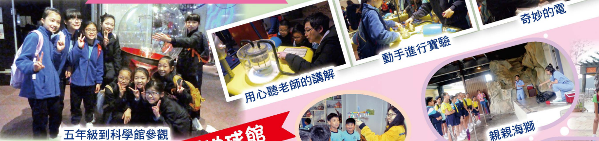
五年級到科學館參觀