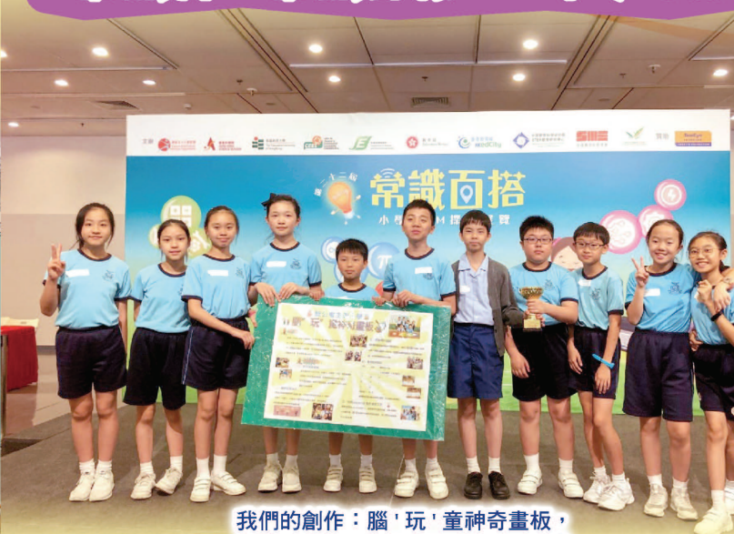
我們的創作：腦「玩」童神奇畫板， 從九十多隊中脫穎而出獲得傑出獎