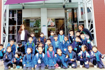
齊來認識昔日的香港