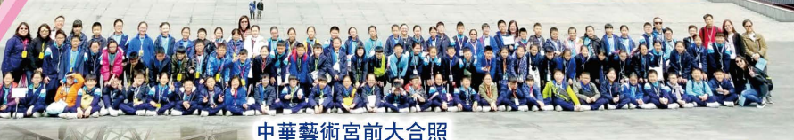
中華藝術宮前大合照