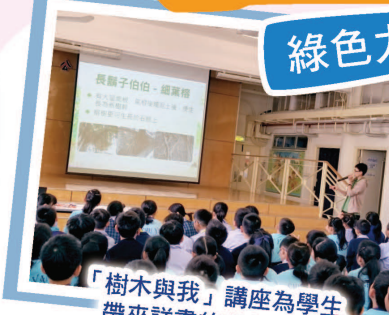
「樹木與我」講座為學生帶來詳盡的環保資訊