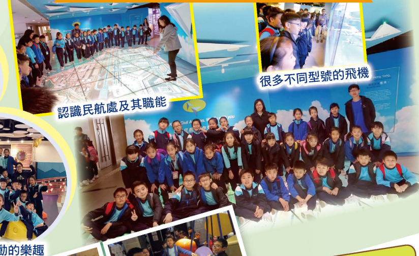
很多不同型號的飛機