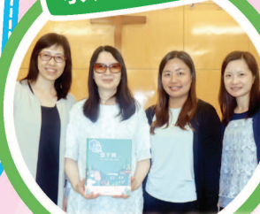
宗教教育中心為教師們舉行工作坊及閱讀講座