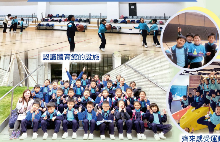
認識體育館的設施