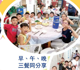
早、午、晚三餐同分享