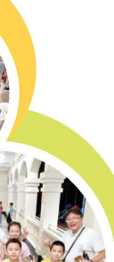
同學們看見校長到來，興奮萬分