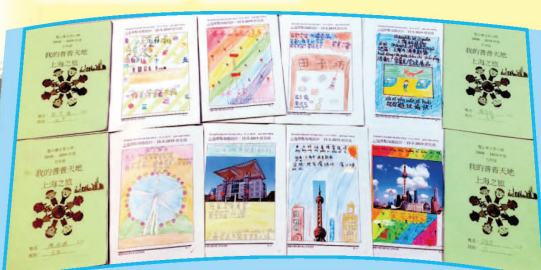
交流後，設計上海景點海報，記下難忘印象