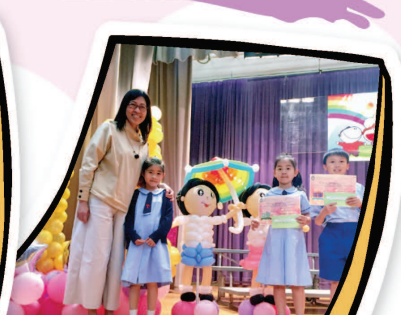
本校學生榮獲聖公會聯校親子設計比賽獎項