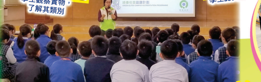
講座讓學生更了解塑膠對環境的影響力