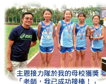
主恩接力隊於我的母校獲獎「老師，我已成功接棒！」