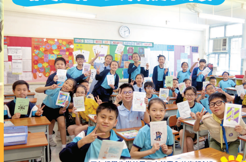
五年級學生樂於展示小錦囊內的海報創作