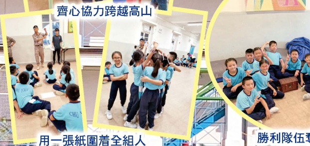
齊心協力跨越高山