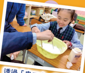
透過「鬼口水」的造法 獲得製作畫板的啟發