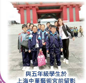
與五年級學生於上海中華藝術宮前留影

今年是我在主恩任教的第 20 個年頭，能夠在這個特別的時刻再度當選「表揚教師」，實在是錦上添花！我要感謝校長和同事與我同行，並且對我的工作肯定和認同！眾所周知，我是一個「天氣迷」，對天文現象極感興趣。相信同學都記得我曾經在「主恩電台」介紹過一本科學類圖書——《幻變的天氣》。其實，我的心情也如天氣般多變。當我看見同學認真學習時，我的笑容會像艷陽般燦爛；當我知道同學身體抱恙時，我就像雨天般愁眉不展；當我看見同學頑皮胡鬧時，訓斥他們的威力絕對不比打雷弱呢！其實以上種種，都是出於我對同學們的着緊。希望同學們能感受到我對他們的愛，並且努力不懈，做一個盡本份的好學生。