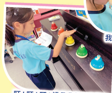
叮！叮！叮！這是我創作的樂句