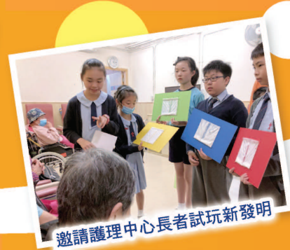
邀請護理中心長者試玩新發明