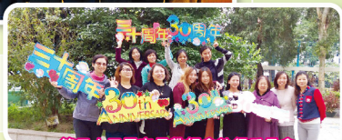
第二十二屆家長教師會執行委員會