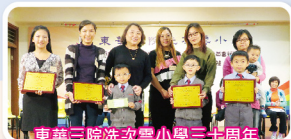
東華三院洗次雲小學三十周年校慶親子標語創作比賽