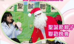
聖誕節親子聯歡晚會