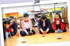
級別：三年級 名稱：動力車王大賽 科學原理：能量轉換「風能轉化為動能」