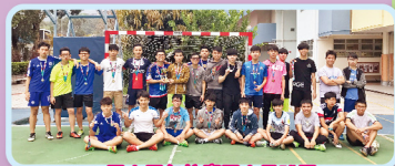
三十周年校慶五人足球盃