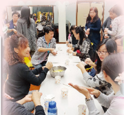
「天然肥皂」及「禪繞鬆一鬆」工作坊