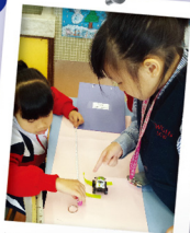
級別：二年級 名稱：無法抗拒的「摩」力 科學原理：摩擦力