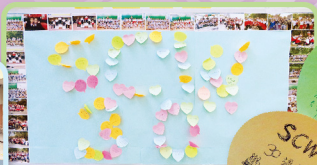
校友對母校的祝賀