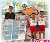
全力以赴，表現出色！