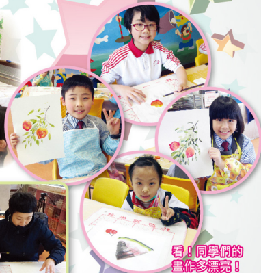
看！同學們的畫作多漂亮！