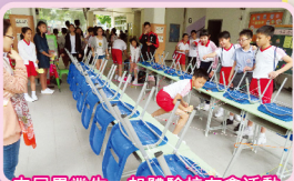
本屆畢業生一起體驗校友會活動