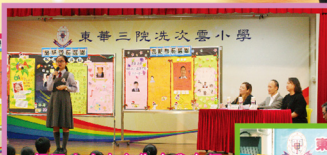
候選人向大家作自我介紹