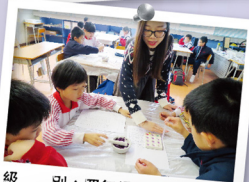
級別：四年級 名稱：PH小偵探 科學原理：酸鹼的特性