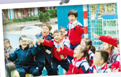
級別：一年級 名稱：肥皂泡魔術師 科學原理：表面張力