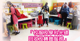
「校服及學科光碟回收及轉贈服務」