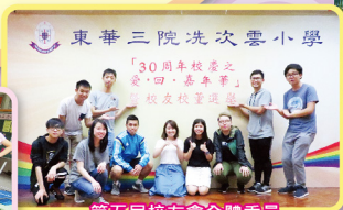
第五屆校友會全體委員