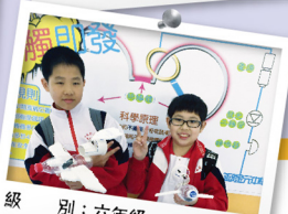
級別：六年級 名稱：解構馬達之謎 科學原理：能量轉換