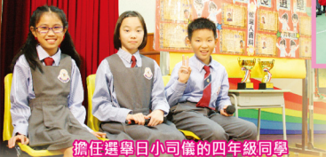
擔任選舉日小司儀的四年級同學