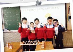
級別：五年級 名稱：建橋工程師 科學原理：旋轉與平衡