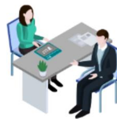
登記服務櫃位或 流動登記隊