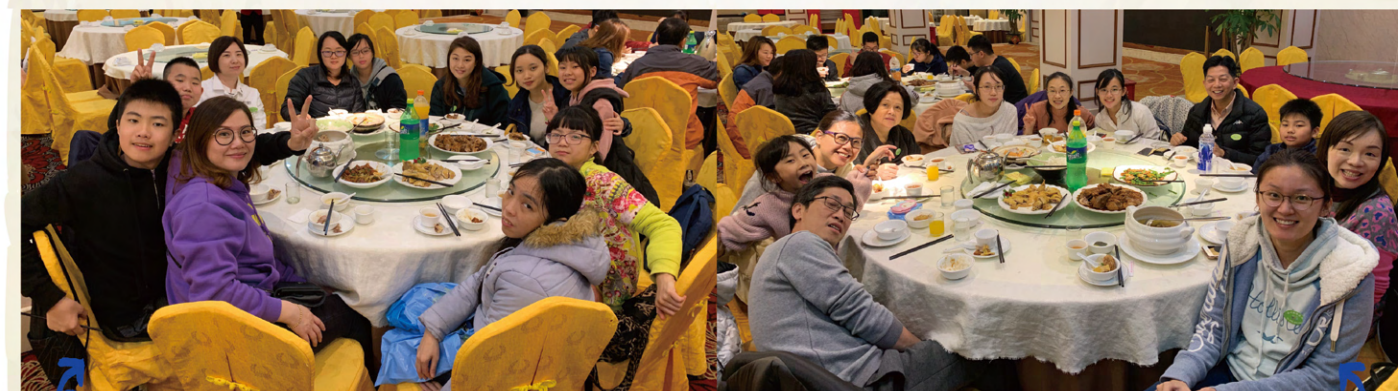
家長、同學和老師們還一起品嚐紅燒乳鴿和客家三杯鴨宴。活動頗受歡迎，期待下一次的親子旅行！