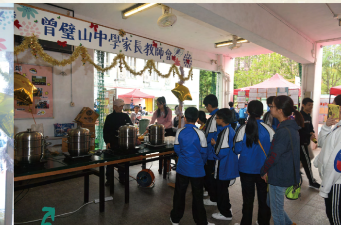
家教會攤位的美食大獲好評，排隊的同學們絡繹不絕。