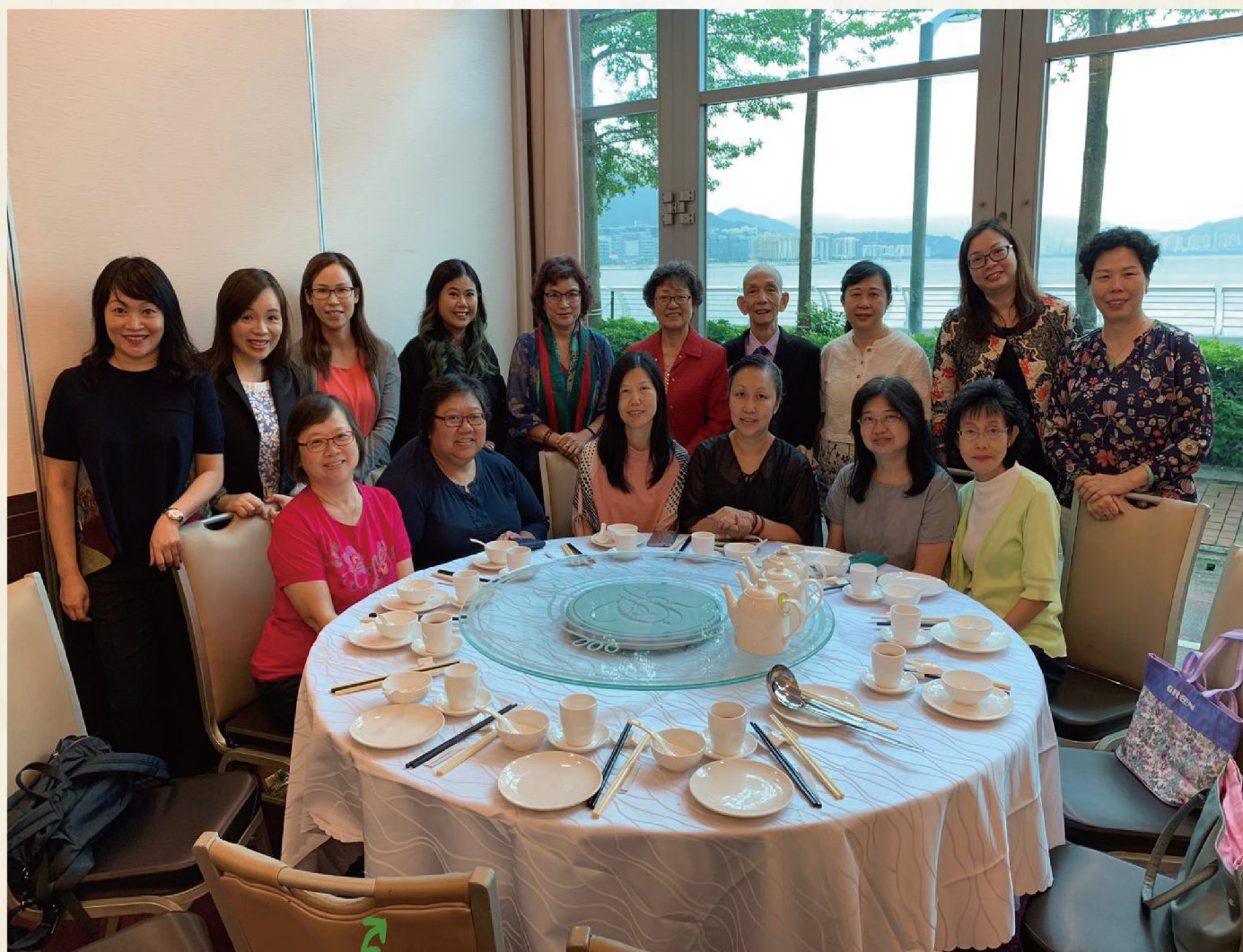
畢業典禮結束後，家長們參與聚餐，其樂融融。