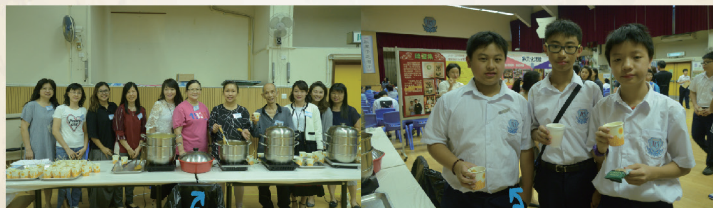
家教會更準備了美味的茶點招待各位家長及同學