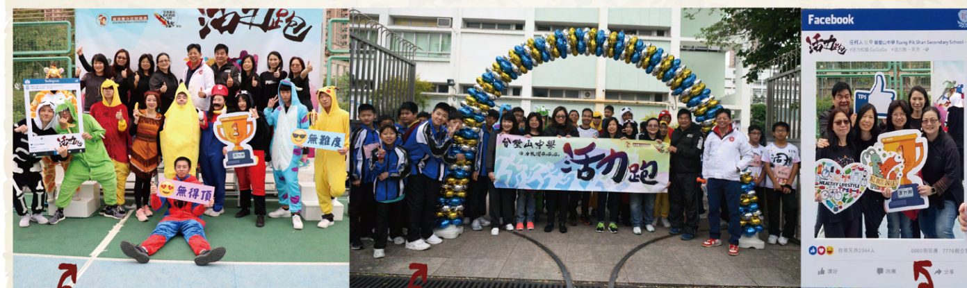
學校于12月14日舉行活力跑，全校學生同部分老師沿馬鞍山海濱跑4000米長跑。