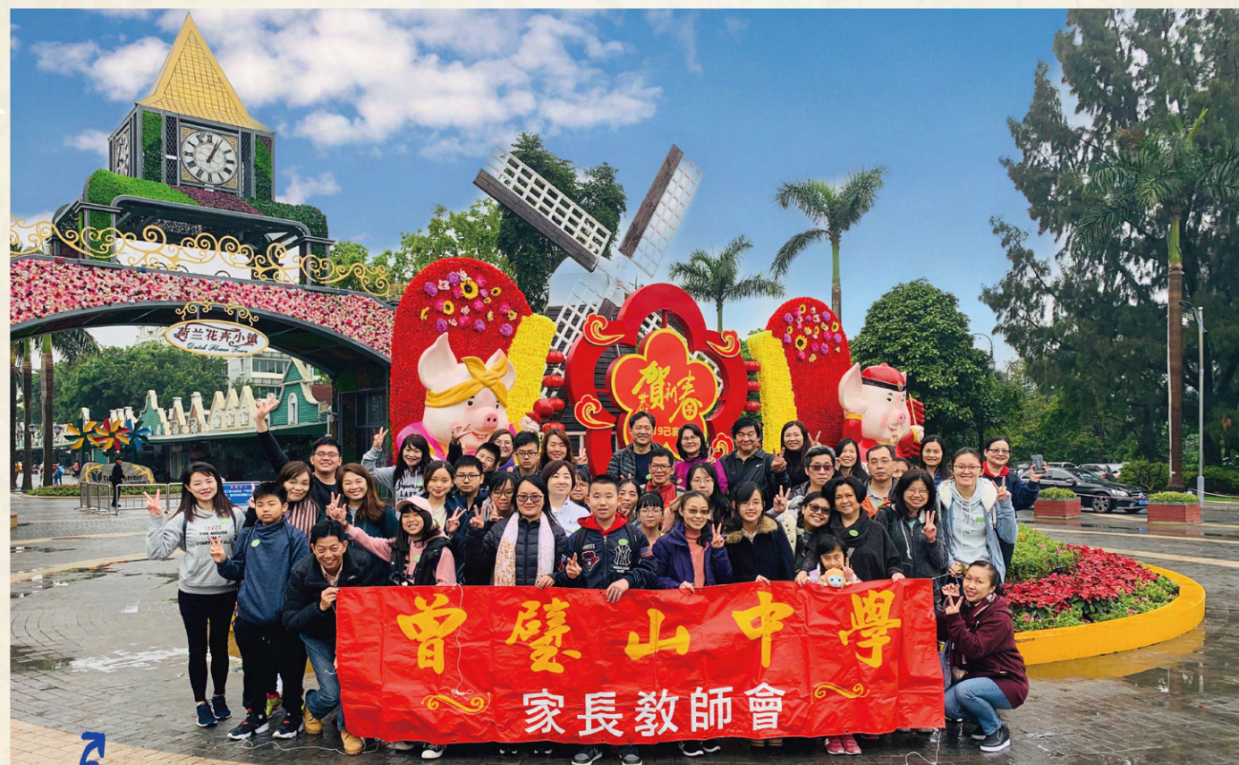
家教會舉行一年一度的親子旅行——「深圳野生動物園，與動物親密接觸」純玩一天游。