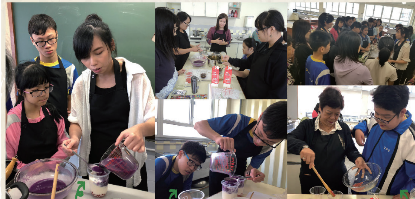
家教會特意邀請臺灣師傅教授製作臺式黑糖珍珠鮮奶、紫薯紅粉珍珠拿鐵。