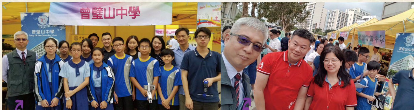
沙田區家長教師會聯會舉行「沙田區中學巡禮」