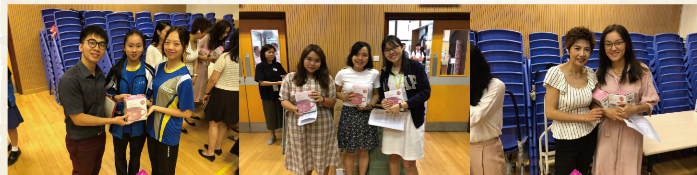
物輕情意重，老師們收到表示謝意的禮物，露出欣慰的笑容。