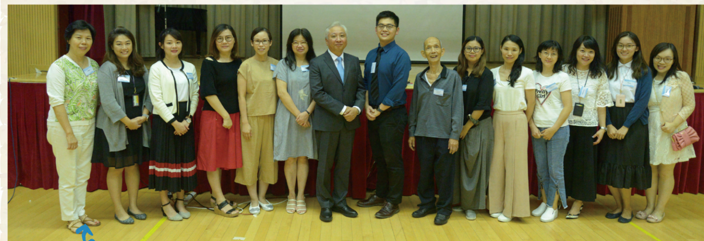
家長教師會第一次會員大會，選出第二十四屆家長教師會委員，并舉行就職典禮。