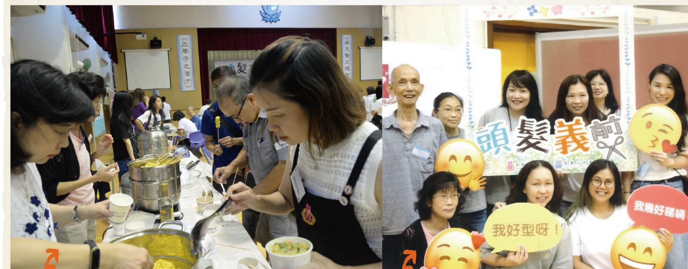
家教會貼心地設置美食攤位，為參加活動人士和義工准備了燒賣，粟米，餅干等豐富小食，讓大家在扮靚的同時也能大快朵頤。