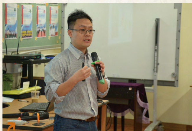
教養子女是一個深奧的課題。家教會於十一月邀請了香港大學物理學博士——張啓賢博士，為家長主持如何教導子女「學會學習」家長工作坊，宣揚正向教育。