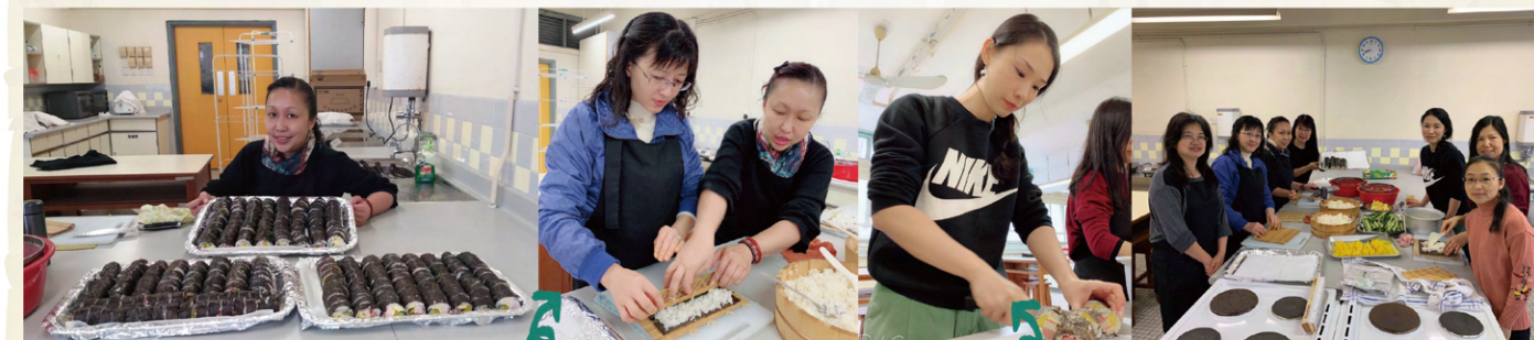
家長們提前來到學校，精心準備。