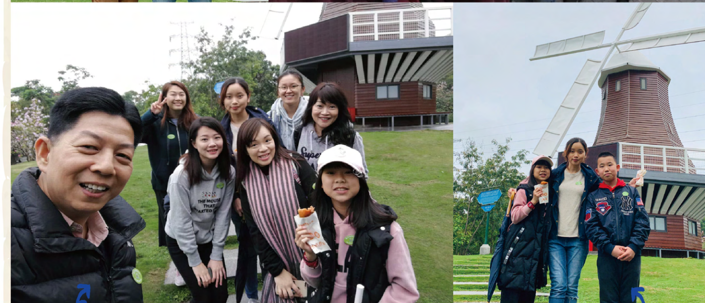
學校旅行首次安排內地景點，於深圳關口集合，游覽荷蘭花卉小鎮和深圳野生動物園。