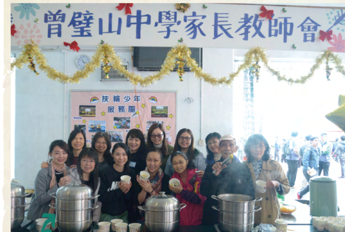
家教會于開放日開設攤位，為參與的中一、中二同學、同區小學生及家長提供燒賣、紫菜卷、雜果賓治等美食。