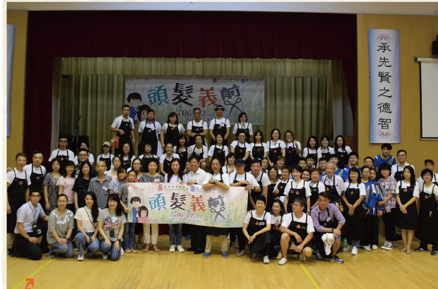
我校與香港髮型協會義剪隊合作，為區內居民舉辦了一次義剪服務日。香港髮型協會義剪隊派出40多名專業髮型師到校提供服務，我校也有70多位師生及家長從旁協助。當日接受剪髮的服務人數超過200人，每一位受惠人士都帶着滿意的笑容離開。