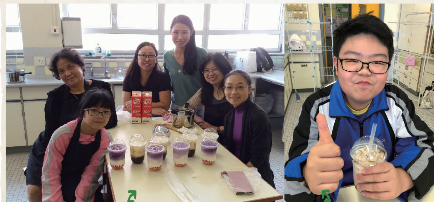
同學家長都表示樂在其中，希望下次繼續參與。