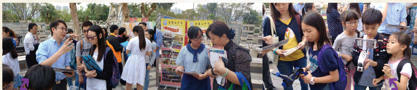
本校老師及學生參與其中，向家長簡介本校的特色，讓區內準備升讀中學的學生及其家長，能對本校有更多認識，從而挑選合適而心儀的學校。