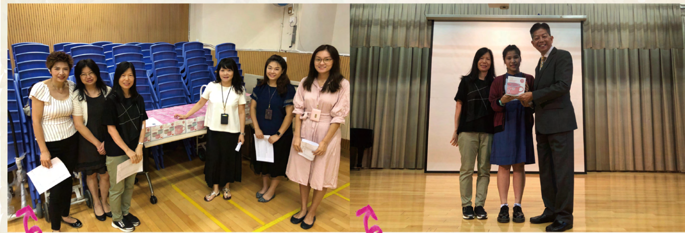
家長當日特意來到學校，在學生陪同下，向學校全體職工送上杯子、潤喉糖等禮物，答謝職工對學生的教導和關愛。