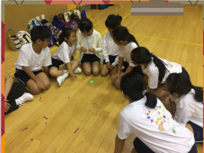
沙田學生大使啟動禮日營體驗活動。