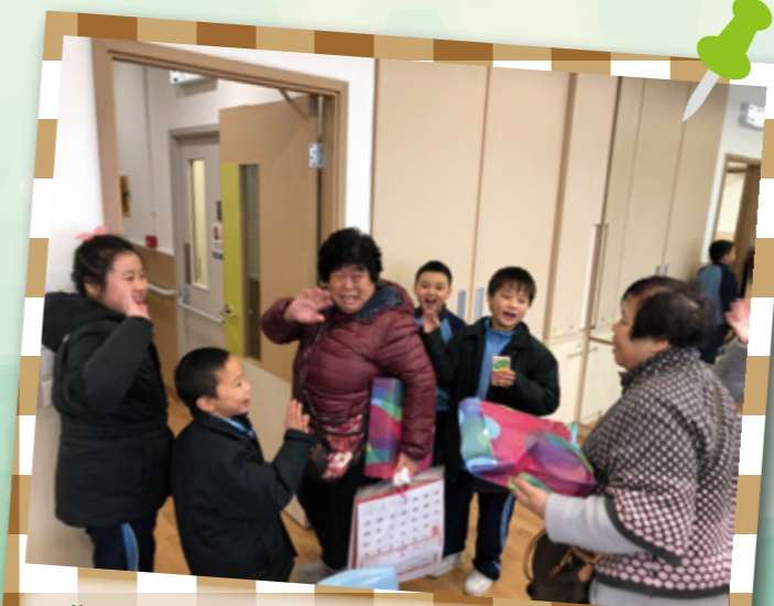
歡送長者離開，大家都玩得好開心！