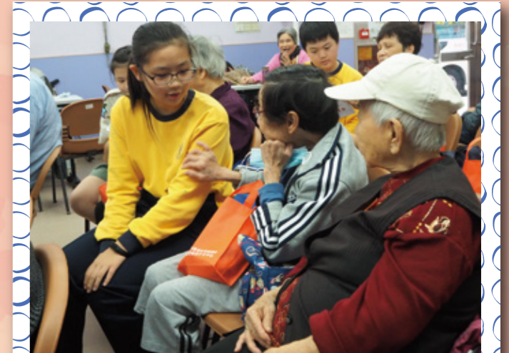
學生大使多麼細心！為長者調整手的高度，才開始量為她量血壓。