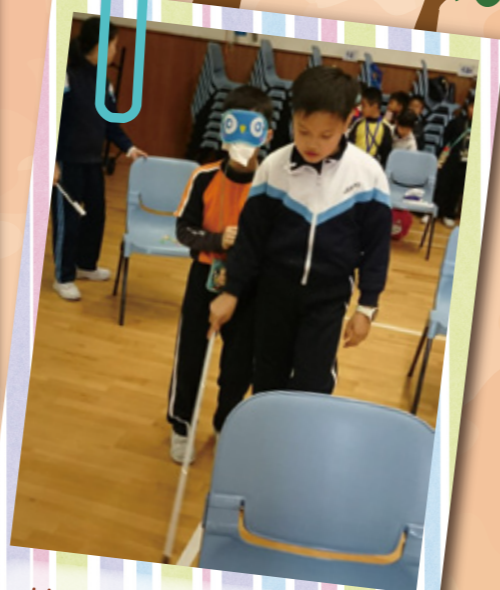
協助同學進行視障體驗。