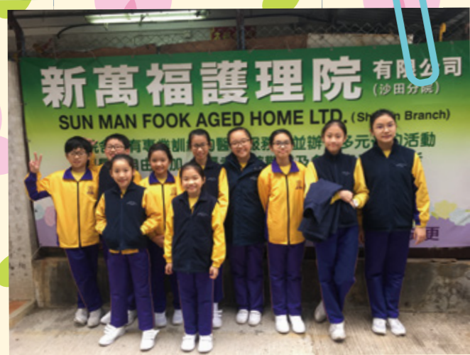
準備就緒！帶著燦爛笑容探公公婆婆，希望為佢地帶來好心情~