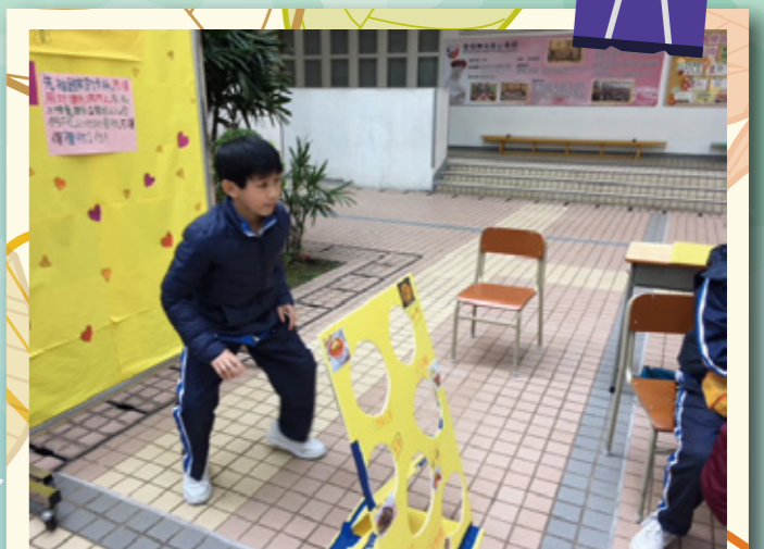
校內服務：文化為題攤位遊戲。