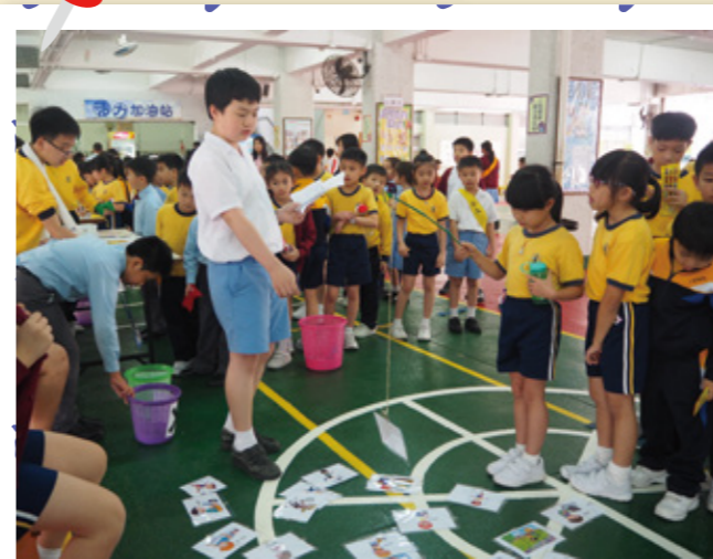
我們在校內進行攤位遊戲，你看，同學能成功釣出健康運動項目。