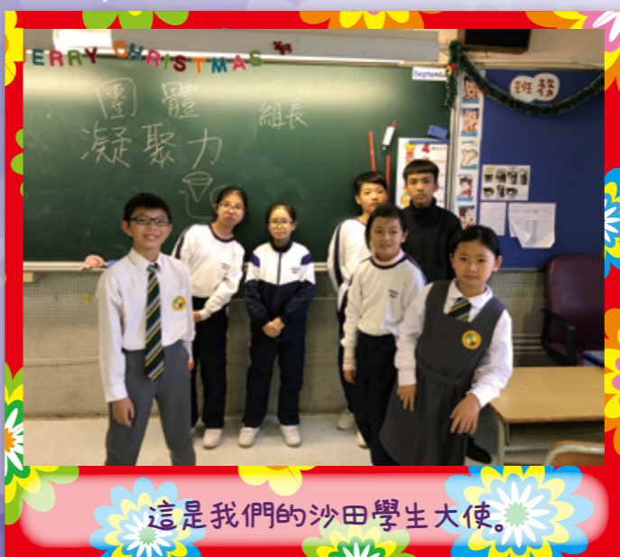
這是我們的沙田學生大使。