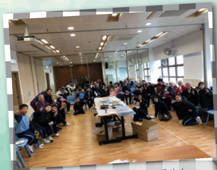
嚟番個服務日嘅大合照先！