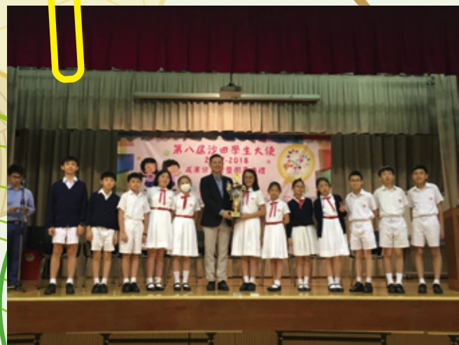
沙田學生大使嘉許。