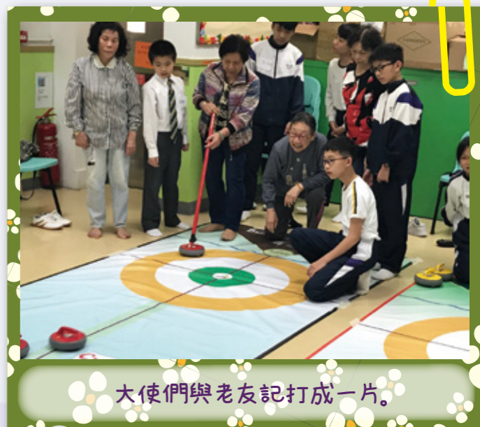
大使們與老友記打成一片。