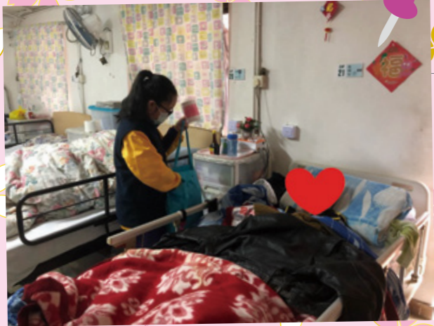
「婆婆，我地帶咗d禮物送比你啊。」