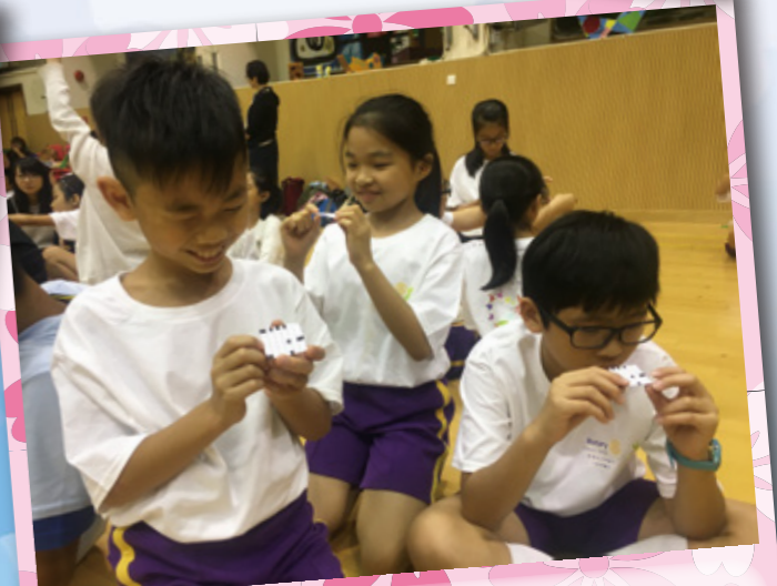
超認真咁睇，義工嘅奧秘係咪隱藏係呢張紙度？