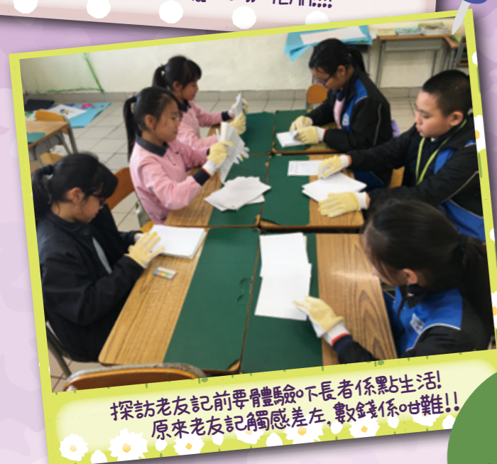
探訪老友記前要體驗下長者係點生活! 原來老友記觸感差左,數錢係咁難!!