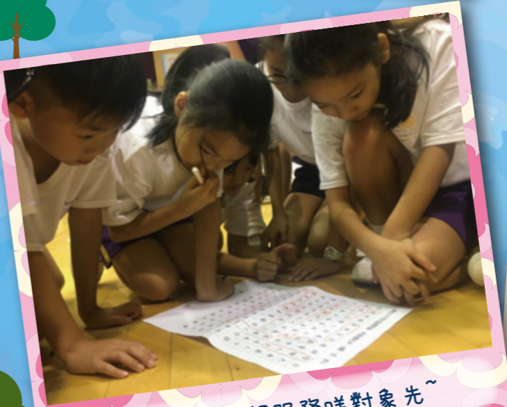
討論下我地想服務咩對象先~