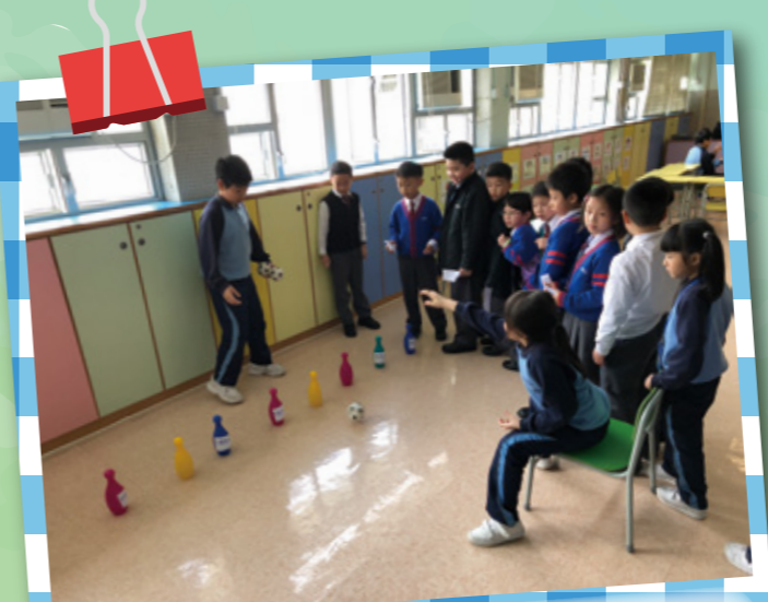
校內服務協助營運攤位遊戲。