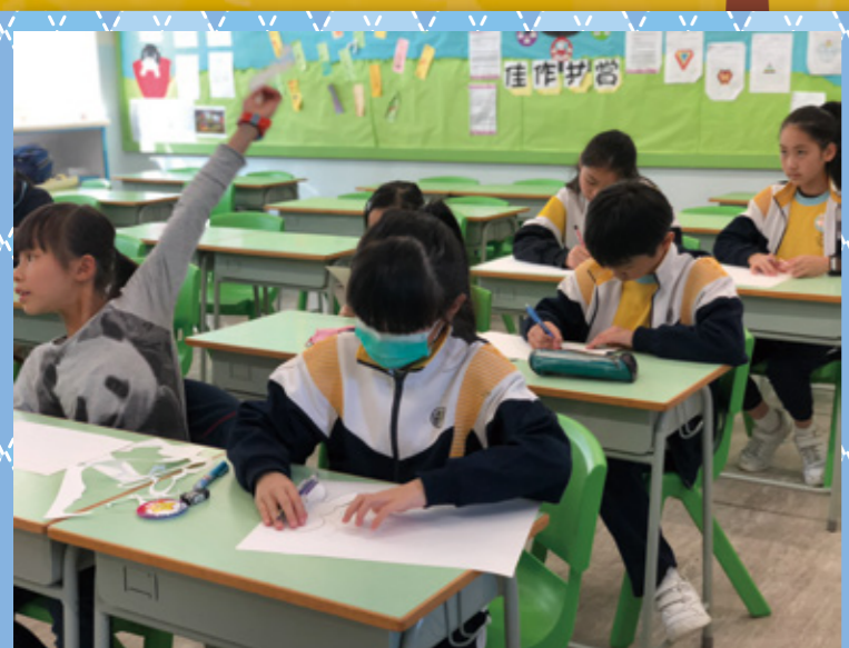
大哥哥準備外框予學弟妹製作復活蛋。