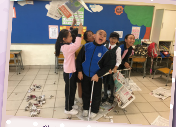
我地可以企嚟入去!! YEAH!!!!