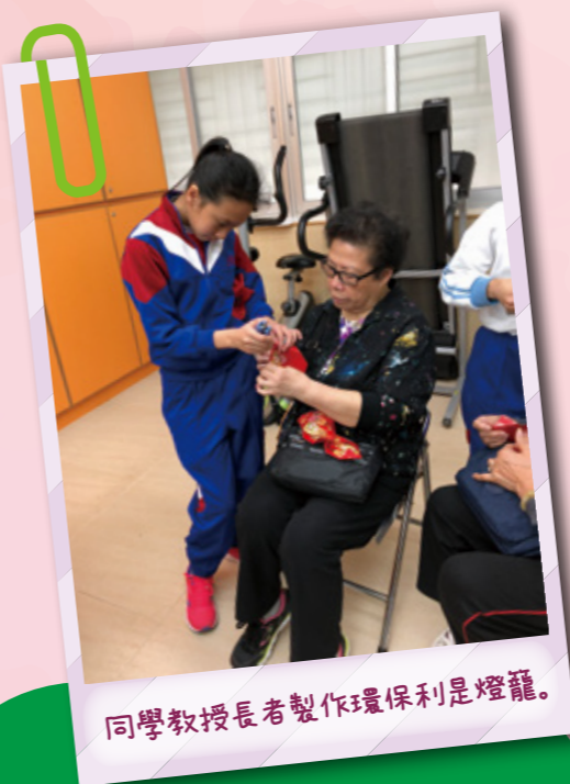
同學教授長者製作環保利是燈籠。