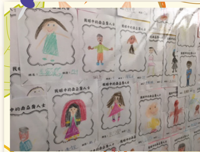
服務作品你在我眼中展示。