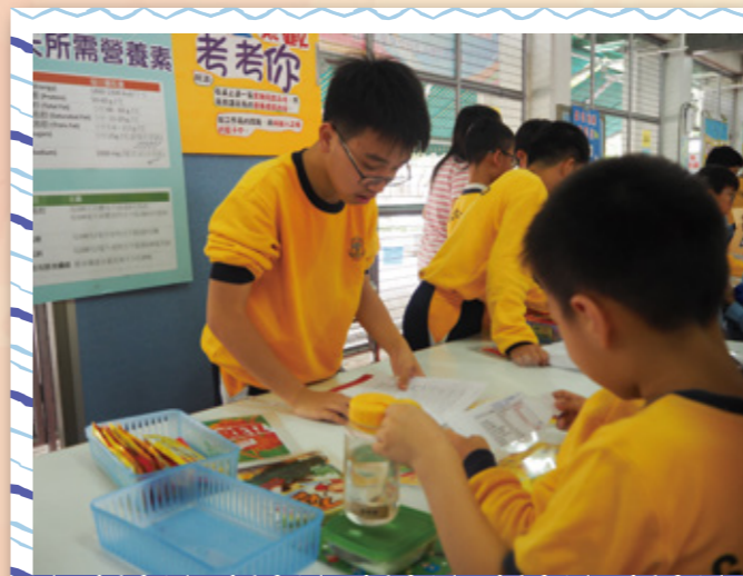
原來營養標籤內容都考不到同學們。