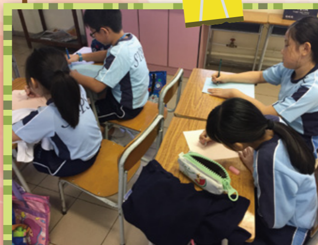
小義工努力設計遊戲內容。