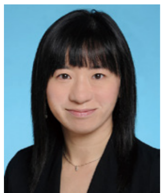
沙田民政事務專員陳婉雯