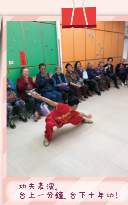
功夫表演。台上一分鐘，台下十年功！