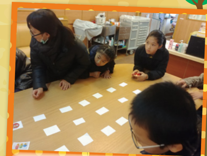
學生大使為服務對象設計小遊戲。