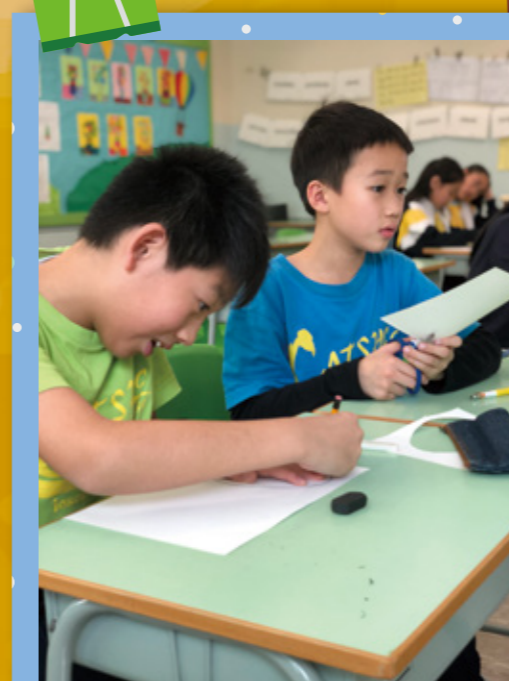
大哥哥用心預備復活蛋外框。