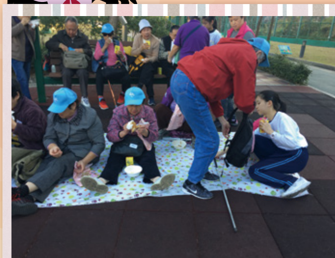
協助視障長者坐下野餐。