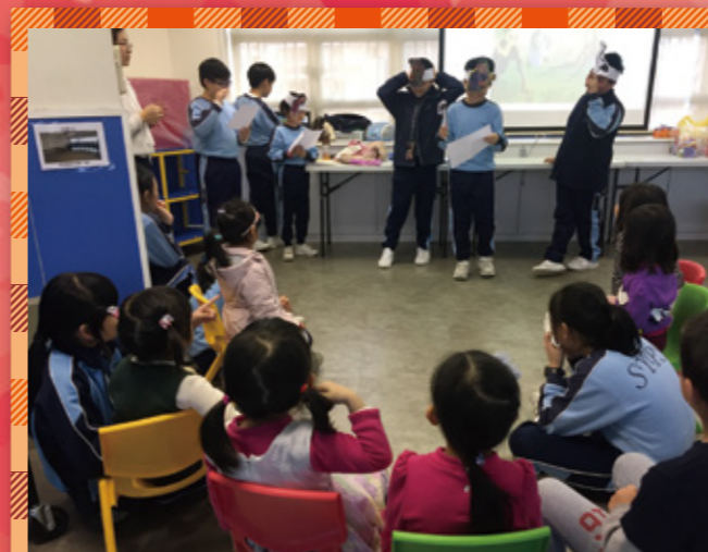
小義工為幼兒表演話劇。