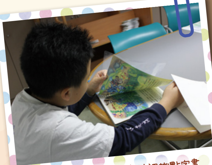
在香港盲人輔導會的圖書館認識點字書。