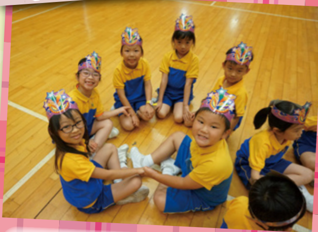
於學校為低年級小學生舉行生日會的分組合照。