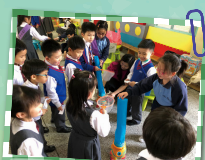
攤位活動好受歡迎！