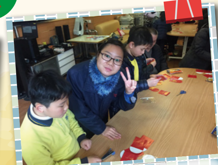
中學生及小學生一同為服務對象 做新年小灯笼作禮物。