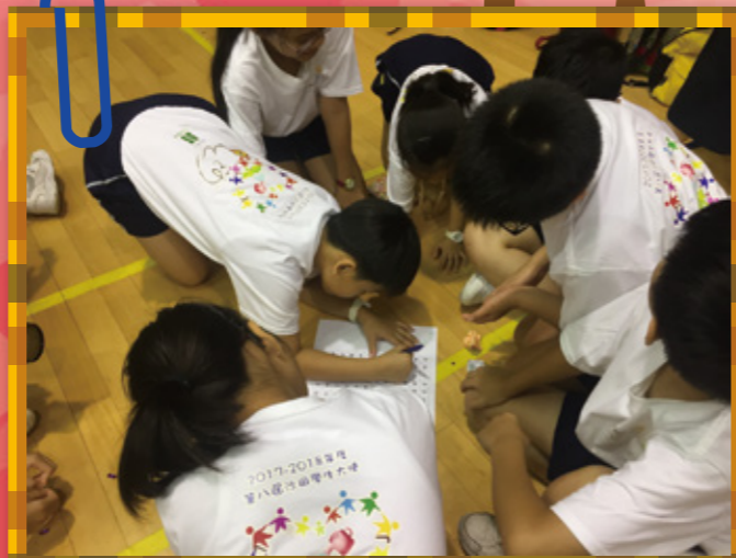
沙田學生大使啟動禮日營體驗活動。