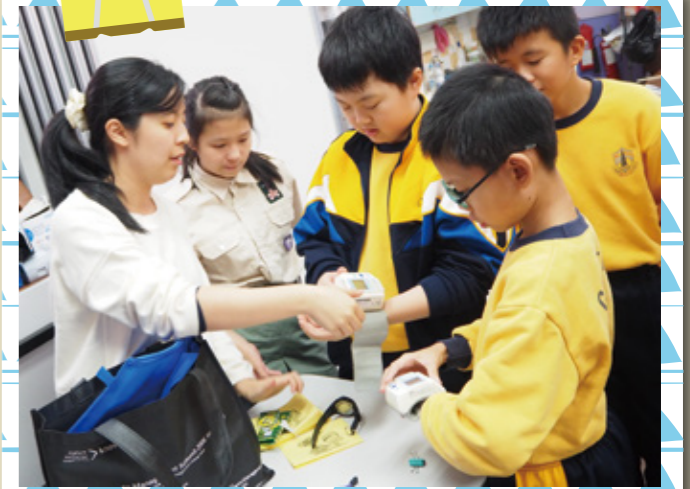
在服務日當天，學生大使們再重溫怎樣使用手腕血壓計。