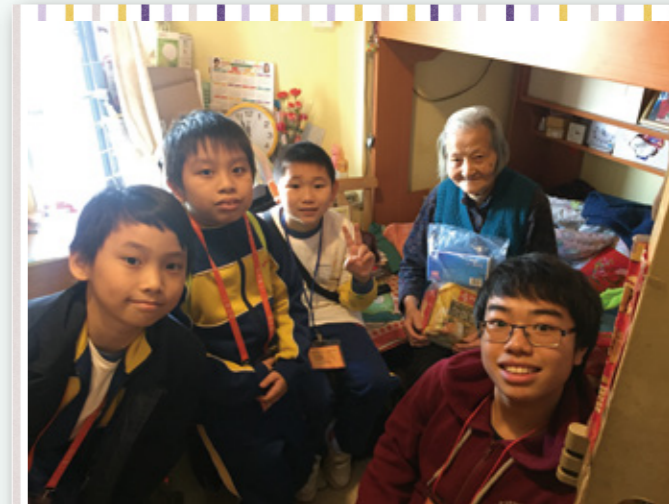
長者屋滿載學生大使們的溫暖熱情。