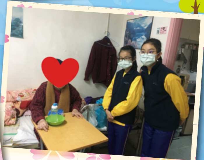
同婆婆傾計，婆婆勉勵我地學習要認真。