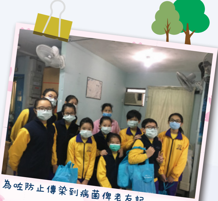
為咗防止傳染到病菌俾老友記，大家都帶曬口罩。