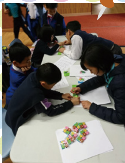
教導同學使用點字排製作點字。