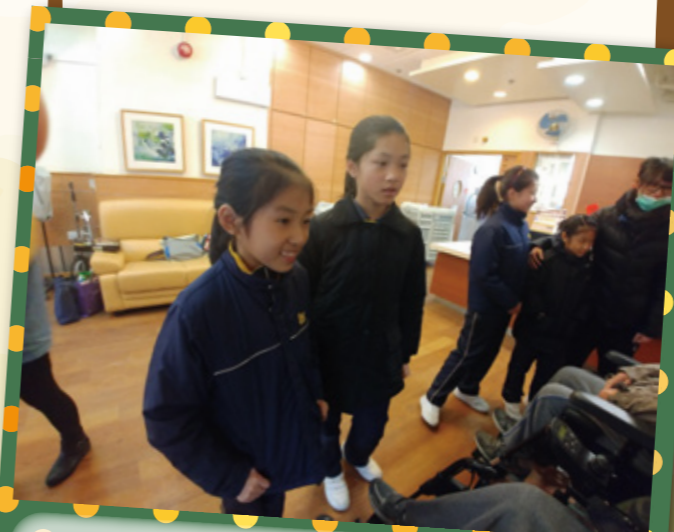
為中心內之全癱人士舉行新春聯歡活動。