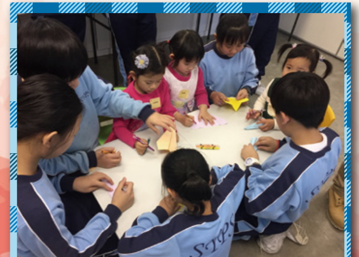
小義工教導幼兒摺紙飛機。