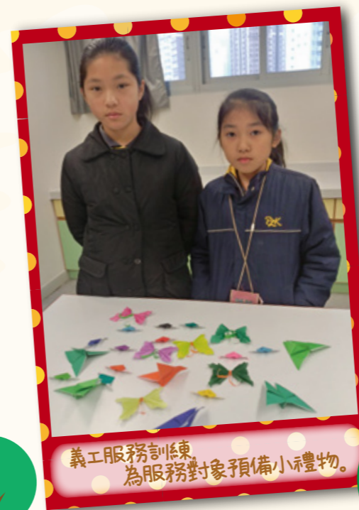
義工服務訓練 為服務對象預備小禮物。