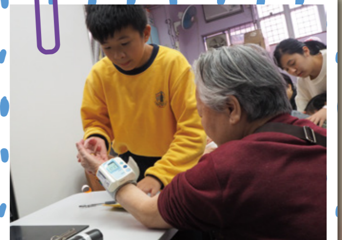
除了替長者進行身體檢查外，我們還跟他們傾談呢！