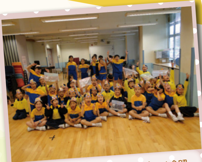
於學校為低年級小學生舉行生日會的大合照。