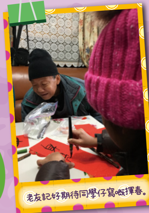
老友記好期待同學仔寫嘅揮春。