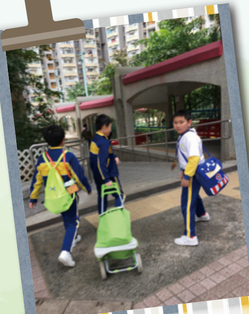
學生大使拖著「禮物車」前往長者家中。