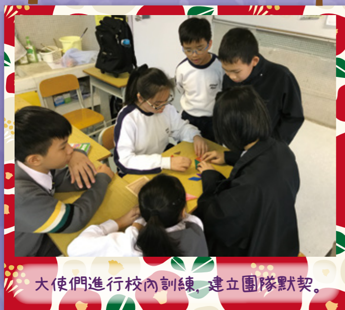
大使們進行校內訓練，建立團隊默契。