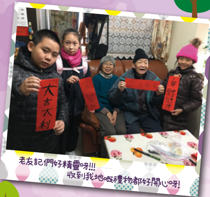
老友記們好精靈呀!! 收到我地嘅禮物都好開心呀!