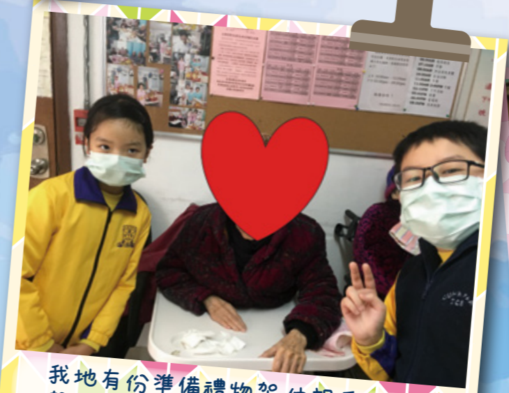
我地有份準備禮物架，仲親手做d 賀年手工比公公婆婆，佢地好開心！