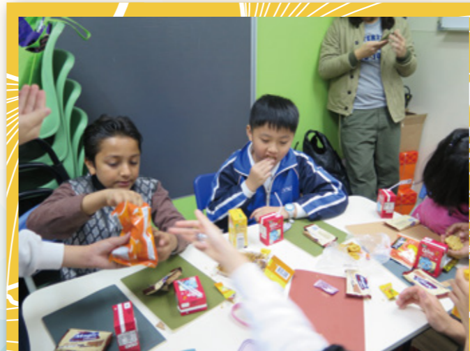
校外服務：食物文化交流。