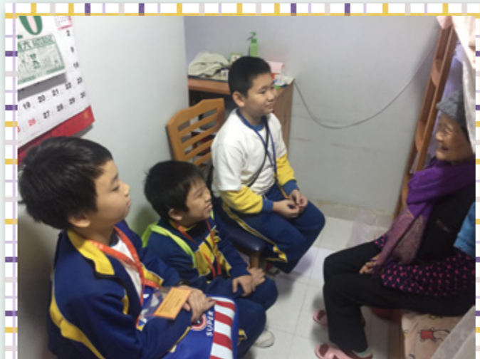
男生們亦與婆婆傾談得很愉快。