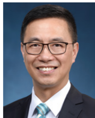
教育局局長楊潤雄