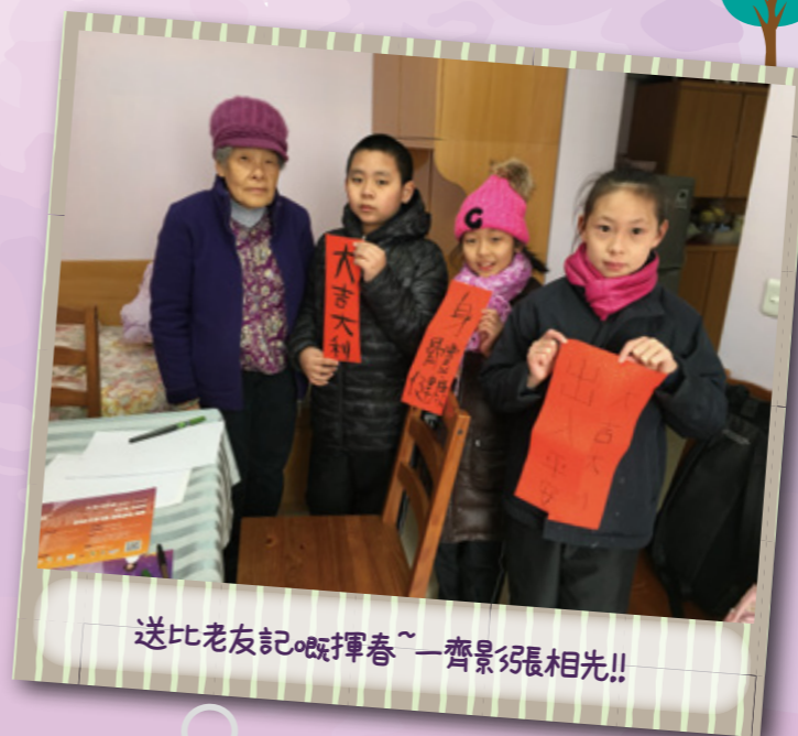
送比老友記嘅揮春~一齊影張相先!!