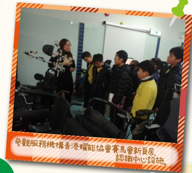
參觀服務機構香港耀能協會賽馬會新居， 認識中心設施。