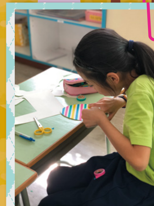
大哥哥利用不同素材製作復活蛋外框。