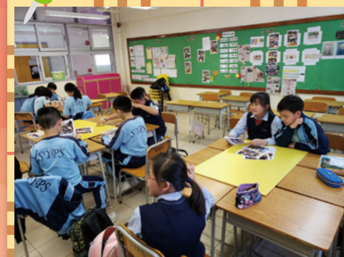
小義工訓練工作坊。