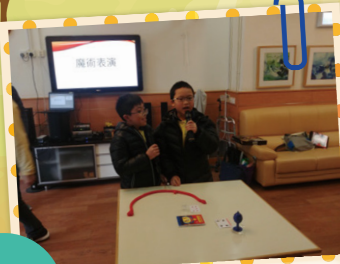
學生大使為服務對象表演魔術。