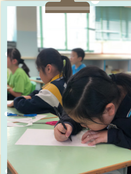
大哥哥用心畫製作復活蛋外框。