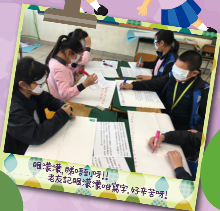
眼蒙蒙,睇唔到呀!! 老友記眼蒙蒙咁寫字,好辛苦呀!