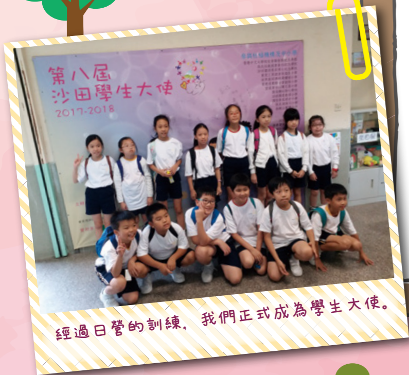
經過日營的訓練，我們正式成為學生大使。