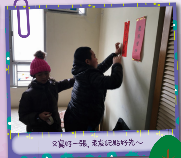
又寫好一張,老友記貼好先~