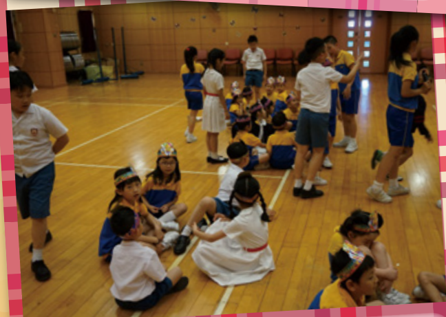
於學校為低年級小學生舉行生日會並進行分組活動。