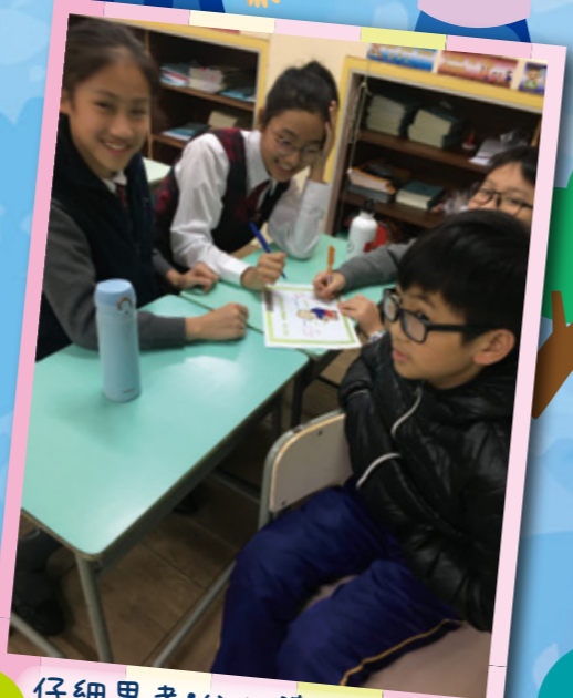
仔細思考：公公婆婆同我地有咩唔同呢？