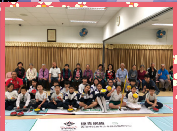
活動完成！成功分享服務，並與老友記建立友誼。