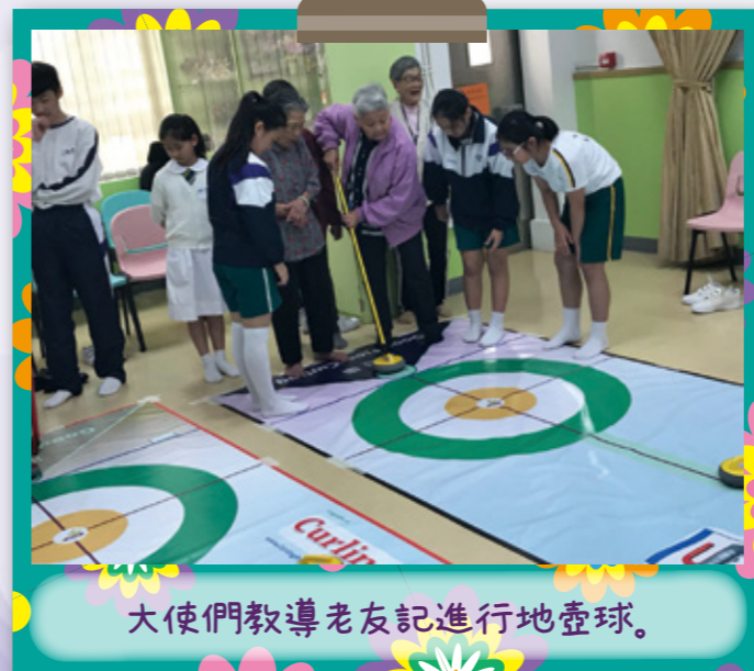
大使們教導老友記進行地壺球。