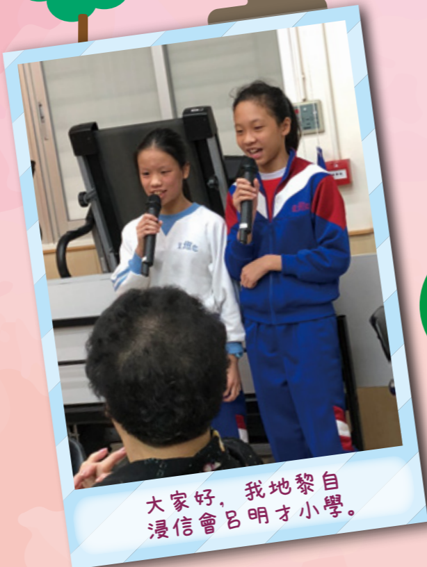
大家好，我地黎自浸信會呂明才小學。