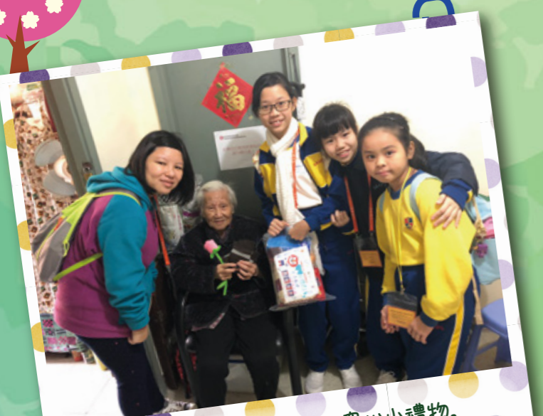
學生大使為獨居長者送上窩心小禮物。