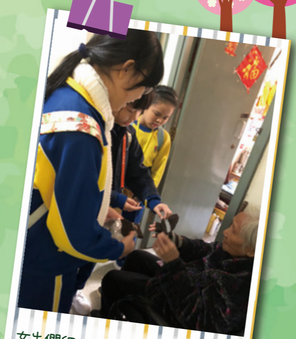
女生們細心講解冷手套的穿戴方法。