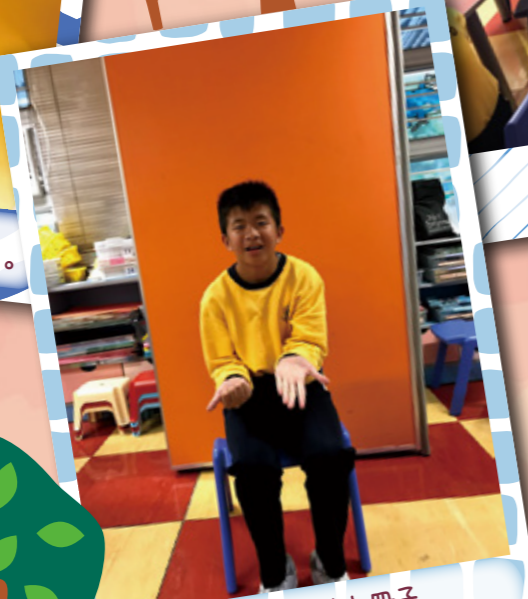
為製作健腦八式小冊子進行硬照拍攝。