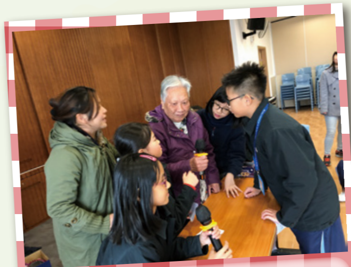
服務日邀請長者玩遊戲。