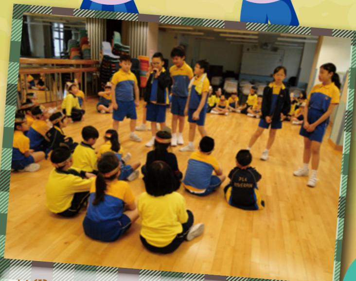
於學校為低年級小學生舉行生日會時的小遊戲。