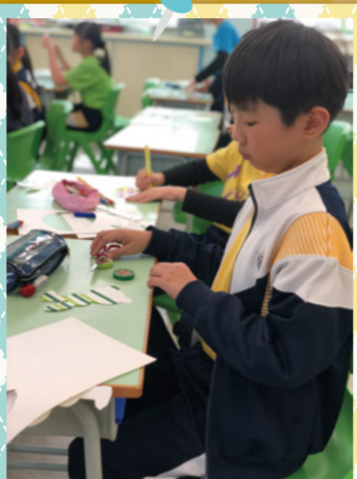
大哥哥利用不同素材製作復活節裝飾。