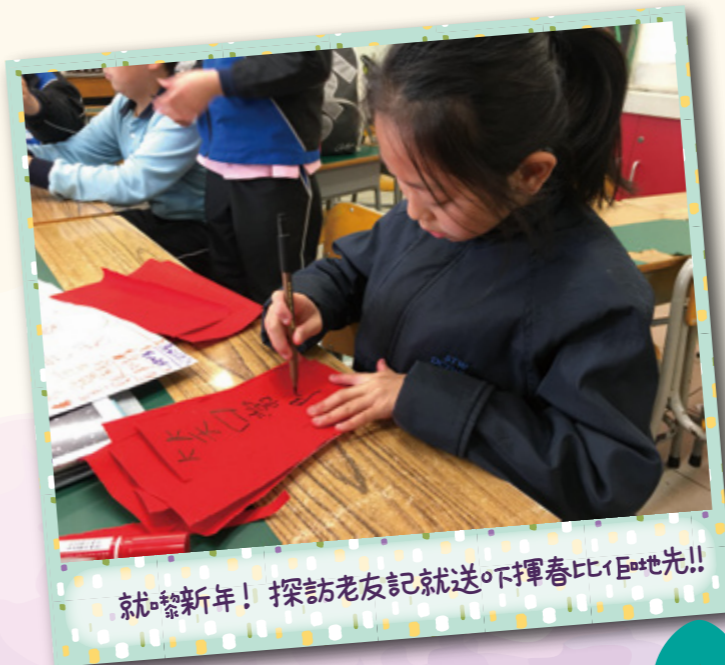
就嚟新年! 探訪老友記就送下揮春比佢哋先!!