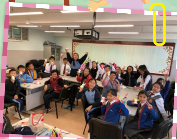
同學仔都學有所成！YEAH！