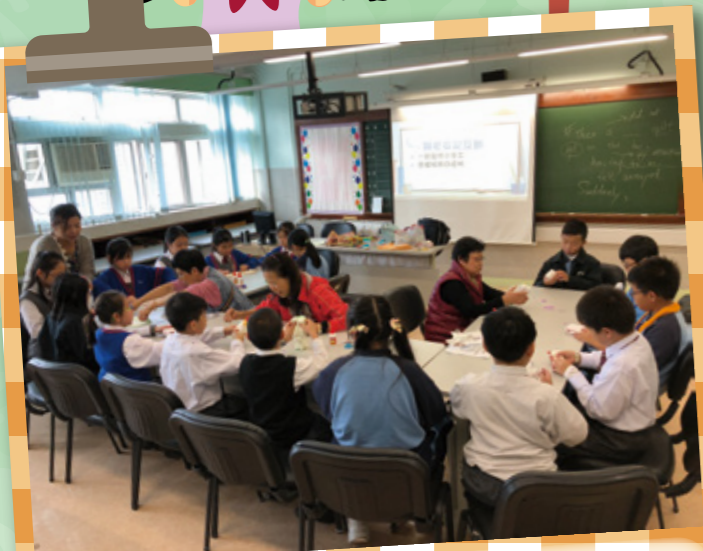
邀請老友仔入校教同學仔做手工。