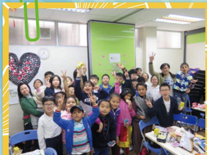
Home center 校外服務合照。