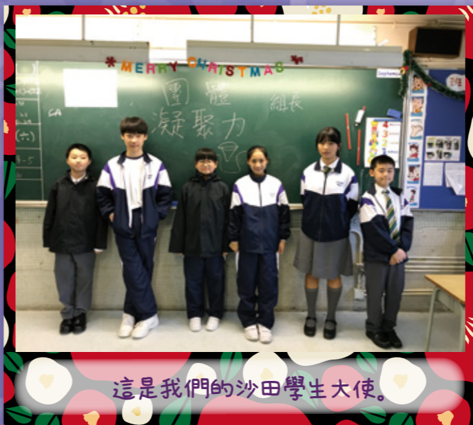
這是我們的沙田學生大使。