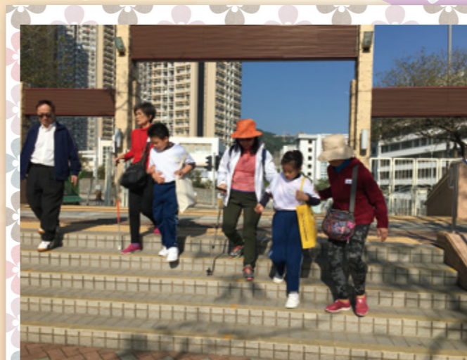
帶領視障長者到公園野餐。