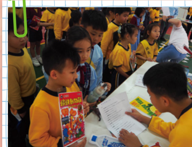
一盒愉快動物餅的糖份含量是否超於我們每天所需？