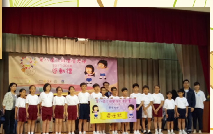
領沙田學生大使委任狀。