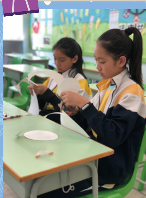
大哥哥用心剪出復活蛋外框。