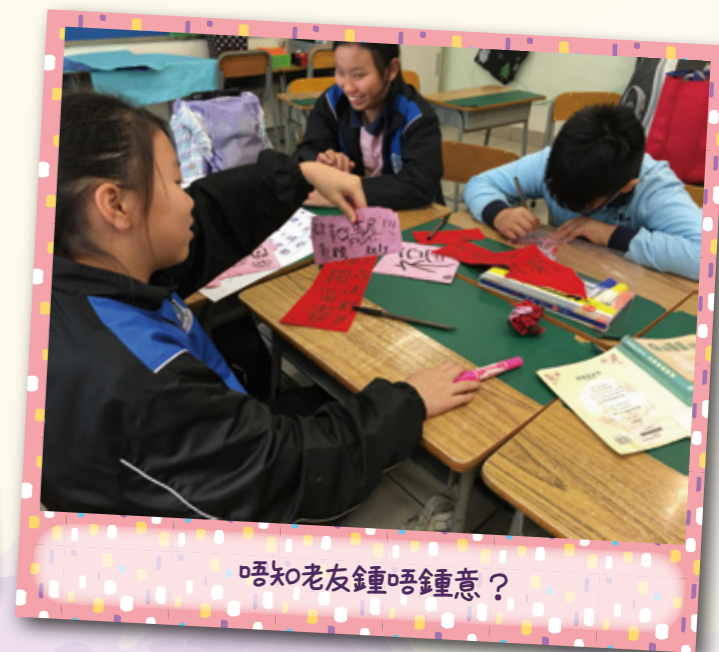
唔知老友鍾唔鍾意?