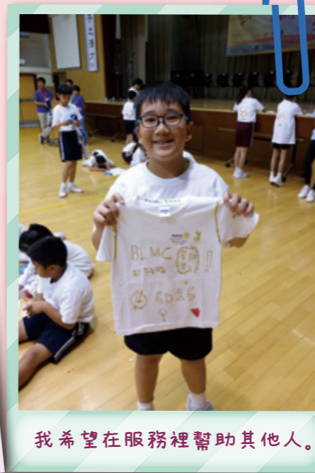
我希望在服務裡幫助其他人。