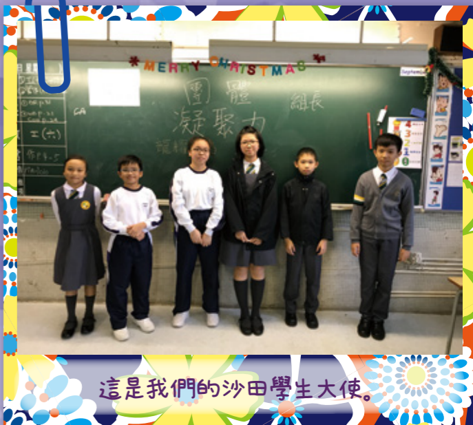
這是我們的沙田學生大使。