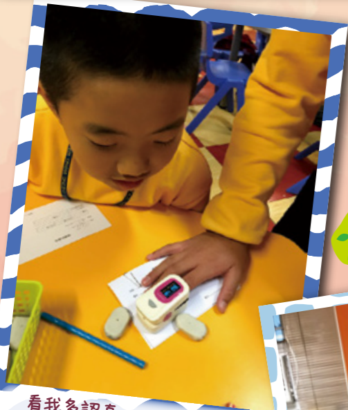
看我多認真，使用血氧機為同學做記錄。