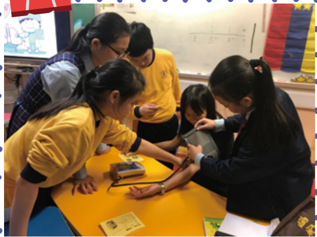
學生大使們小心翼翼地學習使用血壓計。