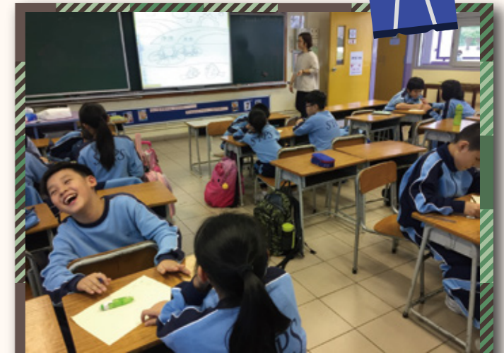
校內分享展板製作。