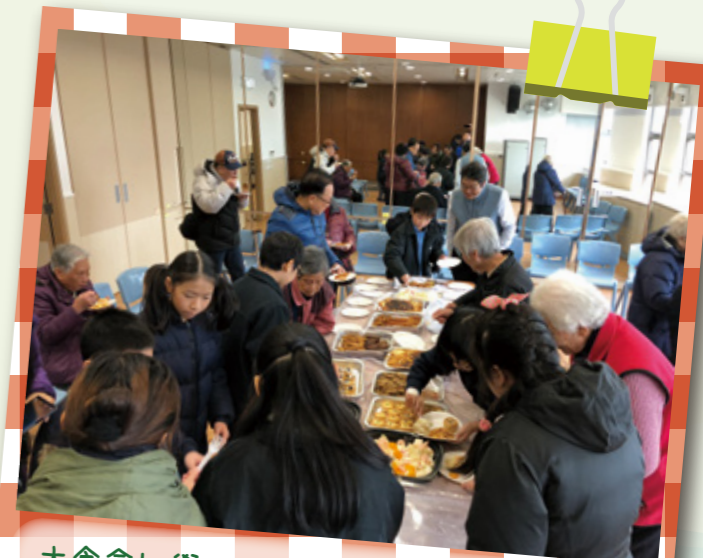
大食會！學生大使們細心地幫長者拿食物。