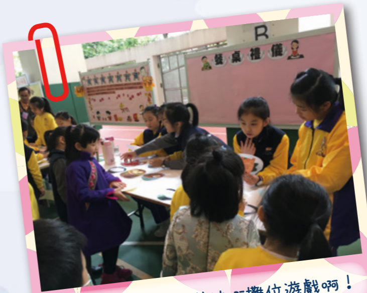
好多同學仔黎玩我地嘅攤位遊戲啊！