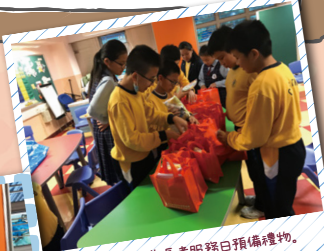
學生大使們為長者服務日預備禮物。