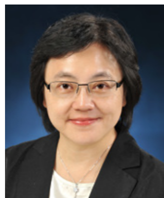
社會福利署 助理署長（青年及感化服務）郭李夢儀