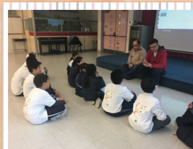
視障人士分享,了解其生活。