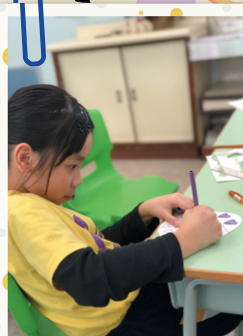
大哥哥利用不同素材為復活蛋添加色彩。