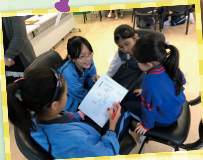
同學仔在工作坊上認真地討論。