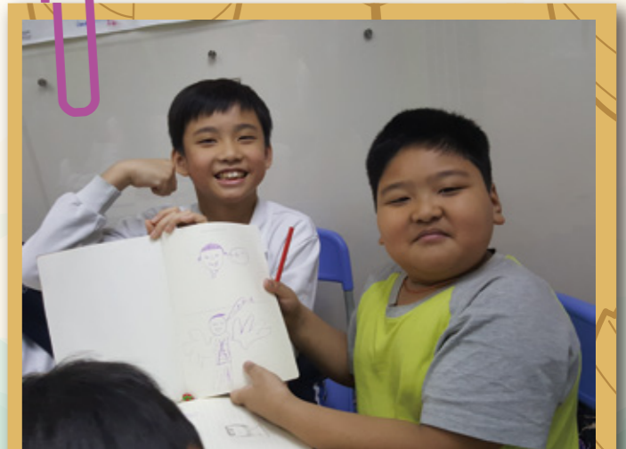
校外服務：在我眼中互動。