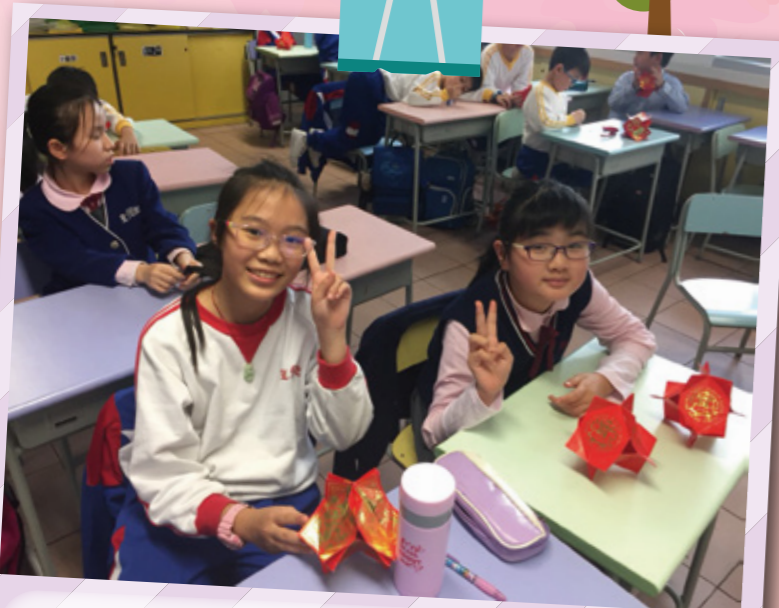
積極學習製作手工，與探訪對象分享。