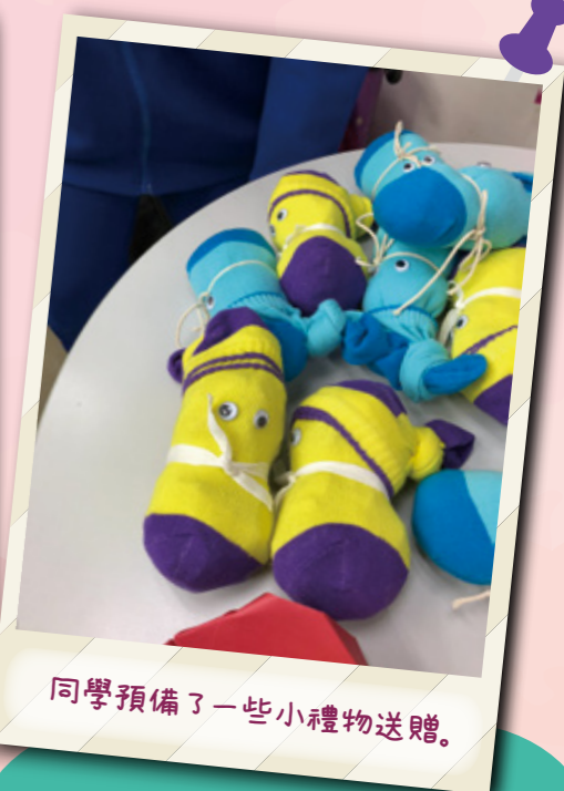
同學預備了一些小禮物送贈。