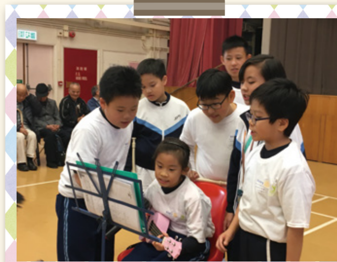
表演小結他及唱歌。