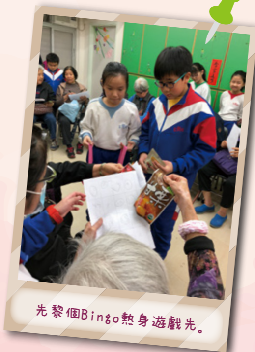
先黎個Bingo熱身遊戲先。