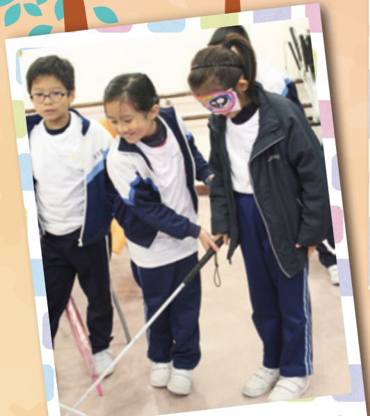
在香港盲人輔導會進行視障體驗。